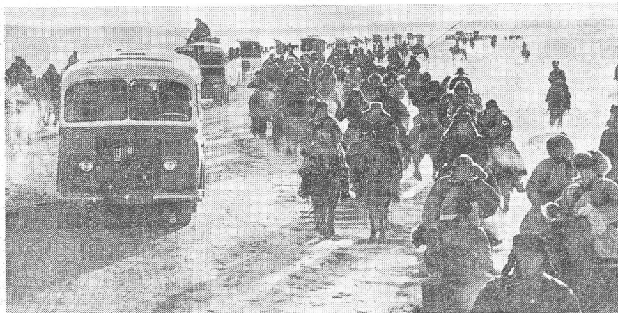
Umsiedlung von Jugendlichen aus Peking in die Grenzgebiete. Die Sinisierung Sinkiangs und der Innern Mongolei macht Fortschritte. Das neue Parteistatut erwähnt die Autonomierechte der ethnischen Minderheiten nicht mehr.

Der Unterschied zwischen dem heutigen Statut zum bisherigen von 1956 und zum sowjetischen von 1961 tritt schon in der Länge dieses wichtigen Dokumentes hervor. So besteht das neue Statut aus einer Einführung («Allgemeines Programm»), welche die Grundsätze enthält, und