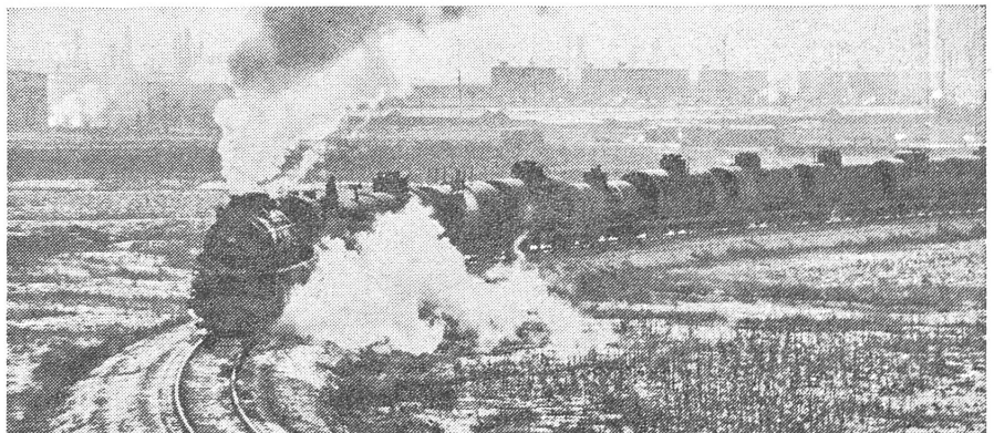
Mit Dampf in die Linkskurve. Oelfeld von Dajjing.