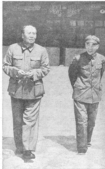
Lin Piao ist als Kronprinz inthronisiert. Ist er trotzdem ein heimlicher Rivale Maos (siehe Seite 11)?

Bibliothek der Bildg. Techn. Hochschule Leonhardstr. 33 8006 Zürich