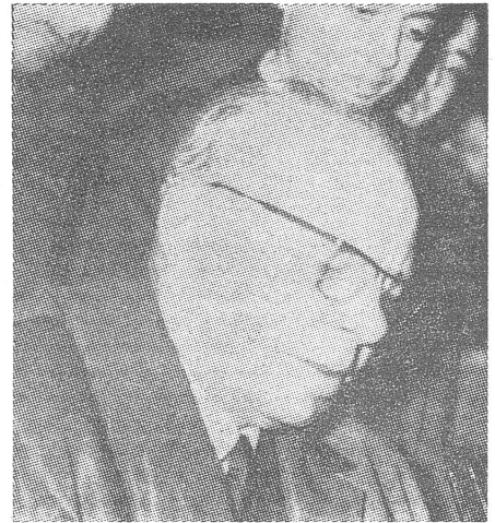
Podgorny in Algier: Aufrichtige Zusammenarbeit.

Der permanente Aufenthalt einer Höchstzahl sowjetischer Kriegsschiffe im Mittelmeer hängt vom Ausbau der sowjetischen Stützpunkte in den