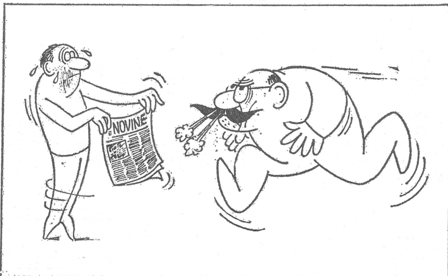
Das rote Tuch (für die Sowjets): die Presse. («Dikobraz», Prag, 4. März)

Herausgeber: Schweizerisches Ost-Institut • Domizil: Jubiläumsstrasse 41, CH - 3000 Bern 6 • Telefon 031 43 12 12 • Telex: 32 728 • Telegramm: Schweizost • Redaktion: Peter Sauer, Christian Brügger • Mitwirkung: Die wissenschaftlichen Mitarbeiter des Ost-Instituts und Auslandskorrespondenten • Administration und Inseratenverwaltung: Peter Dolder • Druck: Verbandsdruckerei AG Bern • Jahresabonnement Fr. 24.— (Ausland Fr. 26.—; DM 24.—), Halbjahr Fr. 13.— (Ausland Fr. 14.—; DM 13.—), Einzelnummer Fr./DM 1.— • Insertionspreise: Gemäss Inseratenpreislisite Nr. 3 • Postcheck ZeitBild 30-24 616 • Banken: Spar + Leihkasse Bern, Konto 153.400.50; Deutsche Bank, Frankfurt a. M., Konto 78-2409.