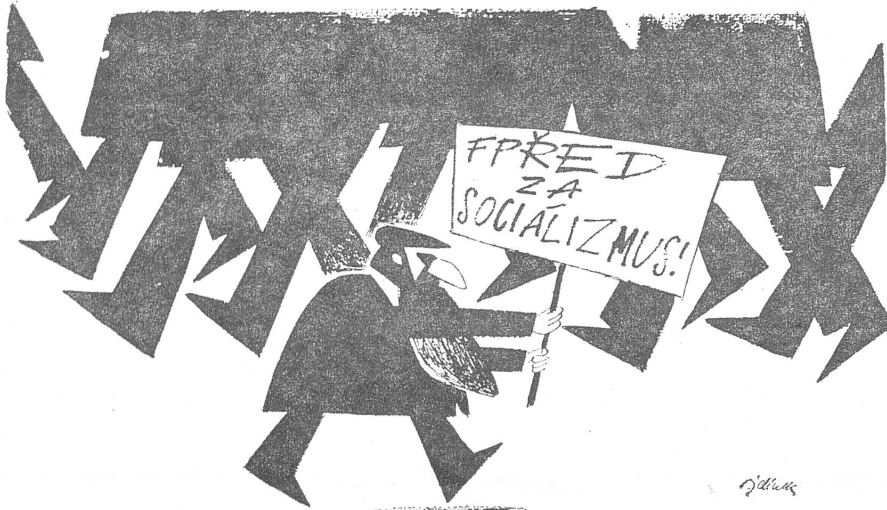
«Vorwärts zum Sozialismus!» («Svet Vobrazech», Prag, 29. April)

Zum 1. Mai veröffentlichte die Prager Illustrierte «Svet Vobrazech» ein Titelbild mit jubelnden Menschen. Daneben als Legenden: «1. Mai» und — in grosser Schrift — «1968.» Wenn die Freiheit des Wortes abgewürgt ist, lässt sich hier und da mit dem weniger leicht als häretisch nachweisbaren Bild noch etwas tun. Aber die politischen Karikaturen werden zensuriert, wie etwa die Nummer von «Signal» vom 22. April zeigte, die auf der Witzseite grosse, weisse Lücken hatte. Von dem, was noch durchkommt, bringen wir hier einiges.