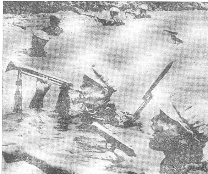
Solange es symptomatisch ist, dass die Sowjets ihre Grenzen mit Panzern bewachen und die Chinesen mit Wimpeln angreifen (sino-sowjetische Grenz-bilder aus «Front», Belgrad), ist auch das gegenseitige Machtverhältnis charakterisiert.

die Aeusseren Mongolei von China nicht gehalten werden. Der seit Mitte des 19. Jahrhunderts zunehmende russische Einfluss und die russischen Aktionen im Jahre 1911 führten zu einer Lösung der Aeusseren Mongolei von China.