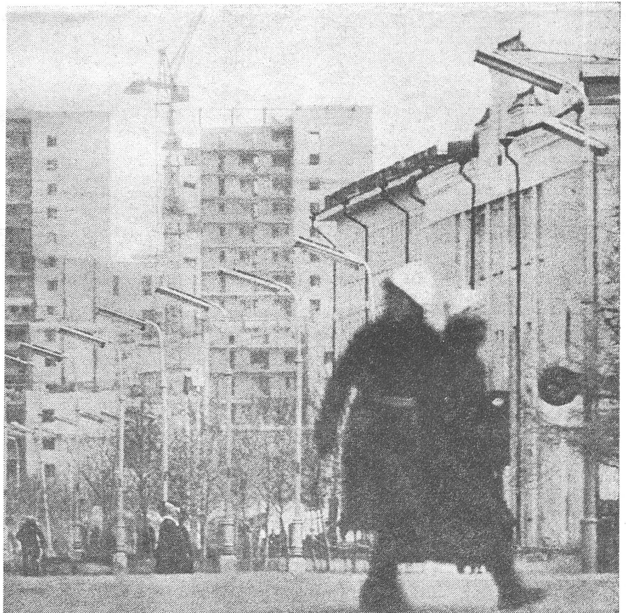
Wirtschaftlich ist heute die Mongolei ein echtes Kind der UdSSR. Strasse in Ulan Bator.

1911, als während der chinesischen Revolution die Mandschu-Dynastie gestürzt wurde, konnte