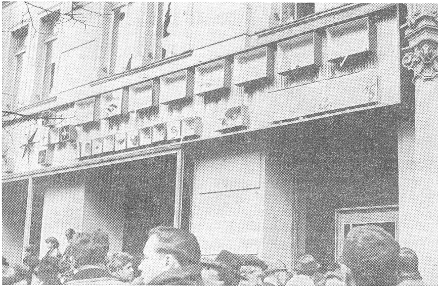
Die Aeroflot-Agentur am Wenzelsplatz am Tage nach der Demonstration. Die Menge stürmte nur den Laden im Parterre und verbrannte dann auf dem Platz Papier und etwas Mobiliar. Die Büros darüber wurden aber nicht betreten, sondern nur durch Steinwürfe beschädigt. Hier aber dürften sich die Archive befunden haben, über deren Intaktheit nach der Demonstration man sich hier verwundert gezeigt hat. Dabei waren sie offensichtlich überhaupt nie in Gefahr. Jedenfalls ist das angebliche «Indiz» kein Grund, an der Spontaneität der Massenkundgebung zu zweifeln.

Ich bemerkte sofort, dass die meisten Spitzenarbeiter in meiner Gruppe mehr Schwätzer als gelernte Arbeiter waren. So stellte ich mich ganz frech als Elektromechaniker vor. Reste aus früheren Studien, hauptsächlich aus Physik und Mechanik, genügten, um die neuen Volksstände zu überzeugen.