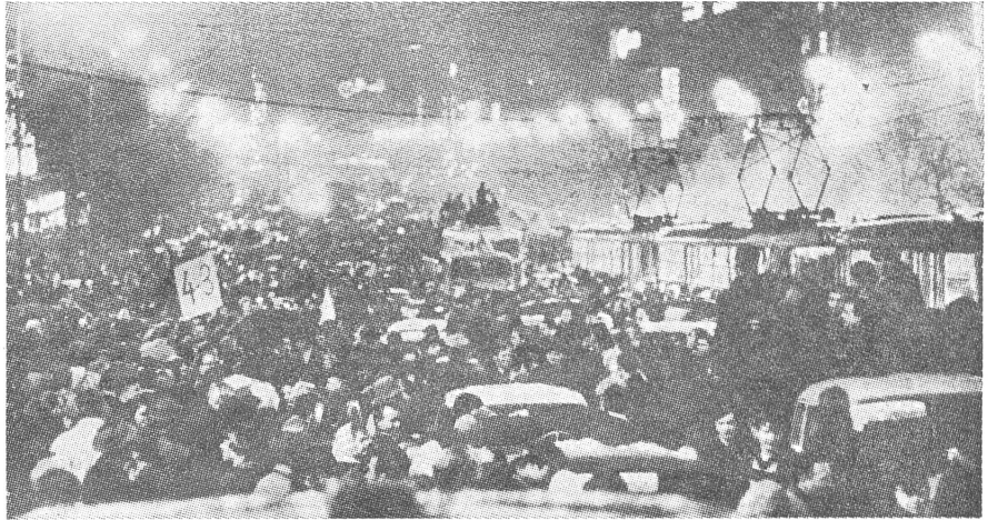
Der Wenzelsplatz in der Nacht auf den 29. März

Der Ort, an dem ich mich melden sollte, lag in einer verlassenem Landschaft inmitten breiter Wälder in der Nähe der Stadt Libere (Reichenberg).