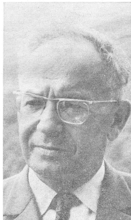
Befehlsvollstrecker Husak. Wie er vor einem Jahre sprach, lesen Sie unter der Rubrik «Der Klare Blick» (Seite 4).

Mittlerweile hat die Schlange den Laokon und seine Kinder ausserstande gesetzt, weiter zu provozieren.