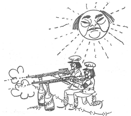
Sonnenstich. («Nardna Mladesch», Sofia)

Die Chinesen könnten versucht sein, die schöne Theorie, wonach man zur Rettung des Sozialismus in brüderliche Länder einfallen darf, auch einmal gegen die Sowjetunion anzuwenden.