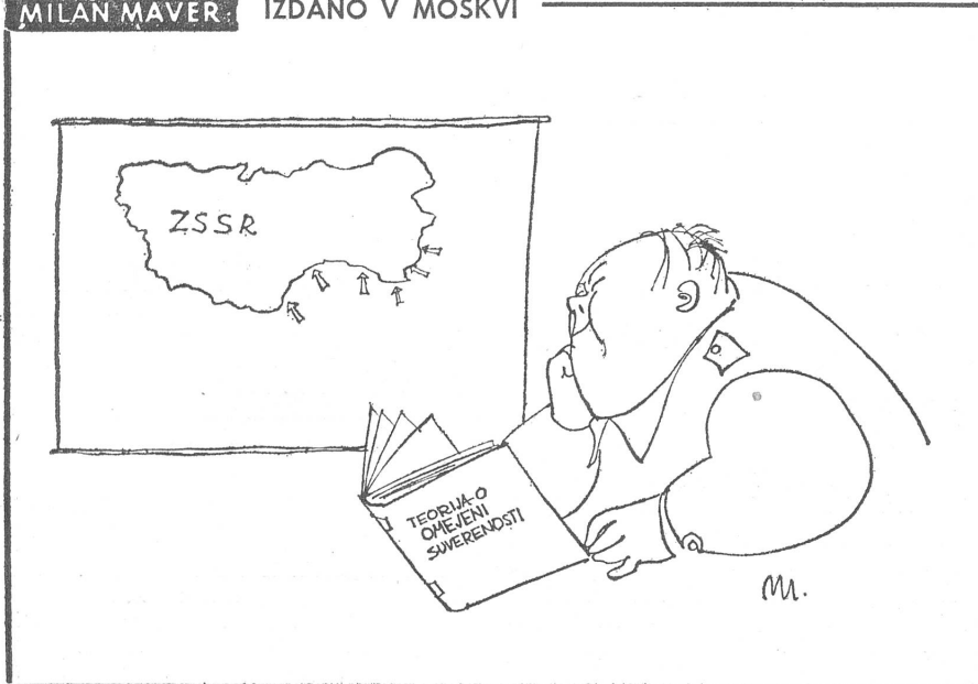
Mao Tse-tung bei der Lektüre der Moskauer Theorie über die begrenzte Souveränität: «Hm, hm, das sollte sich mein Lin Piao doch einmal genau ansehen.»

Die Chinesen könnten versucht sein, die schöne Theorie, wonach man zur Rettung des Sozialismus in brüderliche Länder einfallen darf, auch einmal gegen die Sowjetunion anzuwenden.