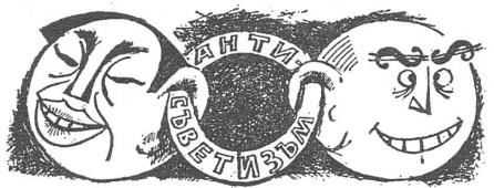
Antisowjetismus als Bindeglied zwischen der gelben Sonne und dem Dollar-Imperium.

Herausgeber: Schweizerisches Ost-Institut • Domizil: Jubiläumsstrasse 41, CH - 3000 Bern 6 • Telefon 031 43 12 12 • Telex: 32 728 • Telegramm: Schweizost • Redaktion: Peter Sager, Christian Brügger • Mitwirkung: Die wissenschaftlichen Mitarbeiter des Ost-Instituts und Auslandskorrespondenten • Administration und Inseratenverwaltung: Peter Dolder • Druck: Verbandsdruckerei AG Bern • Jahresabonnement Fr. 24.— (Ausland Fr. 26.—; DM 24.—), Halbjahr Fr. 13.— (Ausland Fr. 14.—; DM 13.—), Einzelnummer Fr./DM 1.— • Insertionspreise: Gemäss Inseratenpreisliste Nr. 3 • Postcheck ZeitBild 30-24 616 • Banken: Spar + Leihkasse Bern, Konto 153.400.50; Deutsche Bank, Frankfurt a. M., Konto 78-2409.