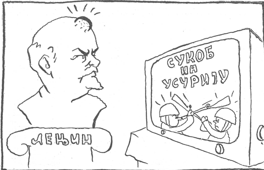
Die Beule. («Pobjeda», Titograd)

Lenins These war es, dass unter sozialistischen Verhältnissen die objektiven Grundlagen zu zwischenstaatlichen Auseinandersetzungen fehlen würden.