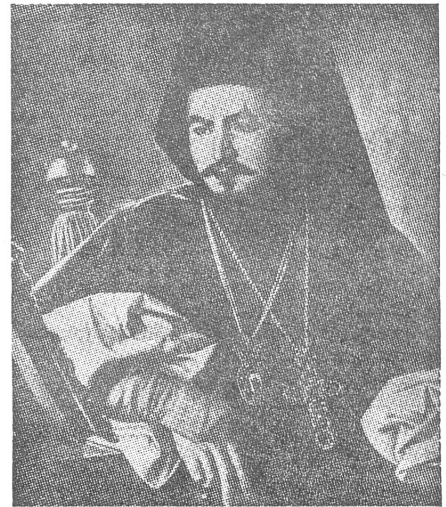
Was wiegt mehr: Die Ehrung durch ein neues Mausoleum oder die Schändung durch die Zerstörung der alten Grabkapelle? Erzbischof Njegos, Fürst und Dichter des 19. Jahrhunderts, droht im 20. Jahrhundert Kirche und Staat wieder gegeneinander zu bringen.