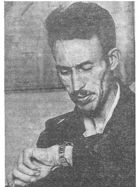
Boumedienne: Auch für andere Probleme ausser der Liquidierung Israels wird es allmählich Zeit.

Um das Wohnungsproblem Algeriens zu lösen, wird angenommen, man müsse an die 100 000 Wohnungen pro Jahr erstellen können. Aber die algerische Zeitschrift meint, dies sei nur im Irrealen vorstellbar. Vorderhand habe man sich auf