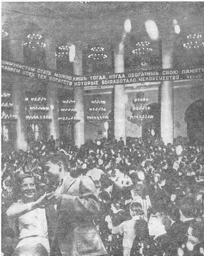
So hat das Tanzen wenigstens einen Sinn. Ball der «Erstgeborenen der Oktoberrevolution» Mitte der dreissiger Jahre.