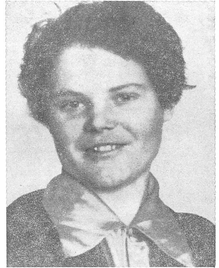
Positives Bauernmädchen 1936. Und 1969.

Eine Neuregelung der Scheidungen liess längere Zeit auf sich warten. Am 8. Juli 1944 hob das Präsidium des Obersten Sowjets ohne vorherige Ankündigung und Frist zwei charakteristisch revolutionäre Gesetze auf: die Anerkennung der «faktischen» (nicht eingetragenen, wilden) Ehen und die freie Scheidung. Das Dekret verwies mit sofortiger Gültigkeit die Scheidungen wieder an den Gerichtshof. Die Kosten des Gerichtsverfahrens mussten die Parteien tragen. Damit wurde eine Scheidung für den grossen Teil der Bevölkerung aus finanziellen Gründen fast untragbar. Die Gebühren und Ausgaben der Prozedur beliefen sich auf das Halbjahreseinkommen eines durchschnittlichen Arbeiters. In der Praxis bedeutete das natürlich, dass die Scheidung sozusagen ein Privileg der besser bezahlten Parteifunktionäre, Manager und gewisser intellektueller Kreise wurde. Der einfache Arbeiter oder Bauer stand ohne Möglichkeiten da — aber wo waren schon 1944 die hehren Ideen der Gleichheit von Anno 1917!?