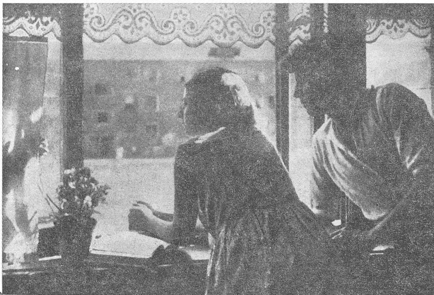
Dekorierter Jungkommunist mit Frau im Heim 1935.

Tatjana, ein Bauernmädchen in einem sibirischen Kolchos, lernt bei einem Sportfest Iwan kennen, Mitglied eines Nachbarkolchos. Sie finden Gefallen aneinander, und nach einem kurzen Spaziergang wirbt Iwan um Tatjanas Hand. Tatjana verspricht binnen acht Tagen Antwort zu geben. Zu Hause bittet Tatjana den Vorsitzenden ihrer Kolchos um Rat. Dieser bespricht das Anliegen mit dem Vorstand. Da es ihnen an männlichen Arbeitskräften fehlt, Iwans Kolchos jedoch einen guten Ruf hat, wird vermutet, dass auch Iwan ein tüchtiger Bauer ist. Also wird Tatjana ermutigt «Ja» zu sagen, mit der Bedingung, dass Iwan zu ihnen zieht. Iwan willigt ein, und der Kolchos veranstaltet eine feierliche Hochzeit. Das Eheglück dauert jedoch nur einige Tage: am 22. Juni 1941 wird die Sowjetunion von Hitlerdeutschland angegriffen; Iwan muss zur Armee. Tatjana bleibt allein, und arbeitet