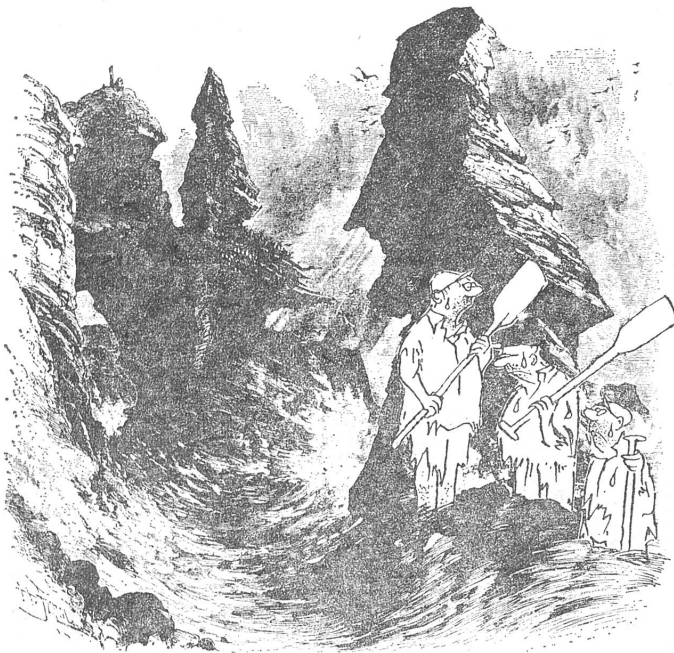
«Nun ja, das Schiff ist zerschellt, aber die Ruder, das möchten wir betonen, halten wir immer noch fest in der Hand!» (4. Februar)

Der sowjetisch verstandene Normalisierungsprozess in der Tschechoslowakei ist zwar in vollem Gange, aber noch leistet die Presse Widerstand, weil die Umbesetzung der Redaktionsposten nach Moskauer Wünschen ihre Zeit braucht. Bis es endgültig soweit ist, können Bilder wie diese hier aus der Prager satirischen Zeitschrift noch vorkommen. Registrieren wir sie also, solange es sie gibt.