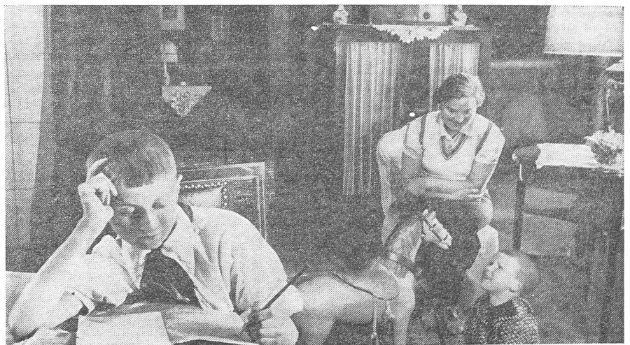
... wurde die Familie wieder zum Ideal.