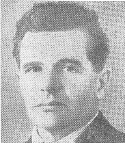
Der Schriftsteller F. I. Panfjorow: Die Babuschka wieder zu Ehren bringen.

ben würde. Aber nein. Nichts dergleichen. Sie zog nur etwas die Brauen hoch und meinte: „Nun, auch im Badezimmer kann man leben. Und im Notfalle“, sagte sie, „kann man da eine Scheidewand aus Brettern machen. Hier zum Beispiel das Boudoir, und hier ist das Esszimmer.“