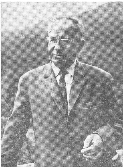
Husak, ein Realpolitiker auf der Höhe.