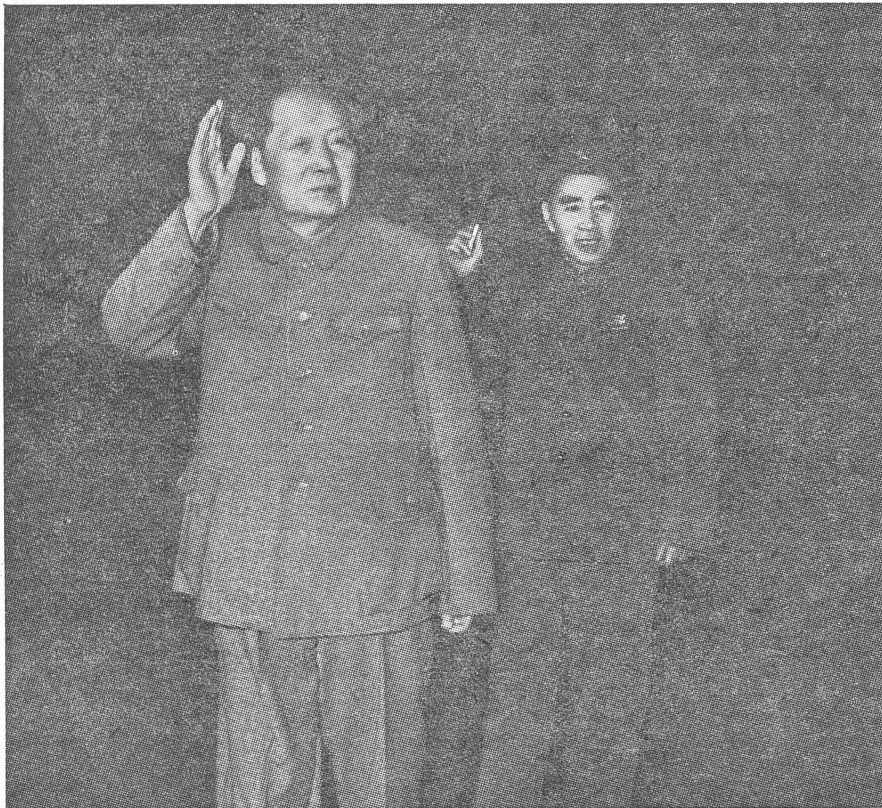
Mao mit seinem designierten Nachfolger Lin Piao. Mao winkt und lächelt, aber er spricht nie direkt zur Menge, obwohl er eine angenehme Stimme hat.