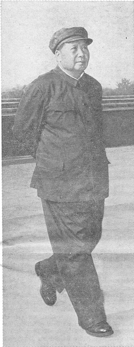
Der Chruschtschew-Stil gilt in China als Inbegriff der Verdammnis — bis auf Maos breite Hosen, die man seinerzeit «Chruschtschewka» nannte.

tat er es mit grosser Mühe und erweckte den Eindruck, dies alles ermüde ihn stark. Er zeigte, dass ihm die Welt seiner Kontemplation viel näher als diejenige der Öffentlichkeit und der Publizität stand. Für Mao aus dieser Zeitperiode könnte man sagen: Er war alles, nur nicht ein Showman.