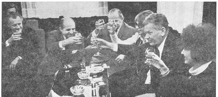
Smrkovsky mit Intellektuellen.

Rumänien markiert, zwischen Zaghaftigkeit und relativer Keckheit schwankend, wieder etwas stärker seine Wünsche nach nationaler Unabhängigkeit. Seine Hoffnung besteht darin, dass ihm Moskau das im Interesse seiner florierenden Grossmachtinteressen ausserhalb seiner bisherigen Zuständigkeitsphäre durchgehen lässt. Frankreich dagegen hat... Ach so, richtig. Frankreich gehört ja gar nicht zu Osteuropa.