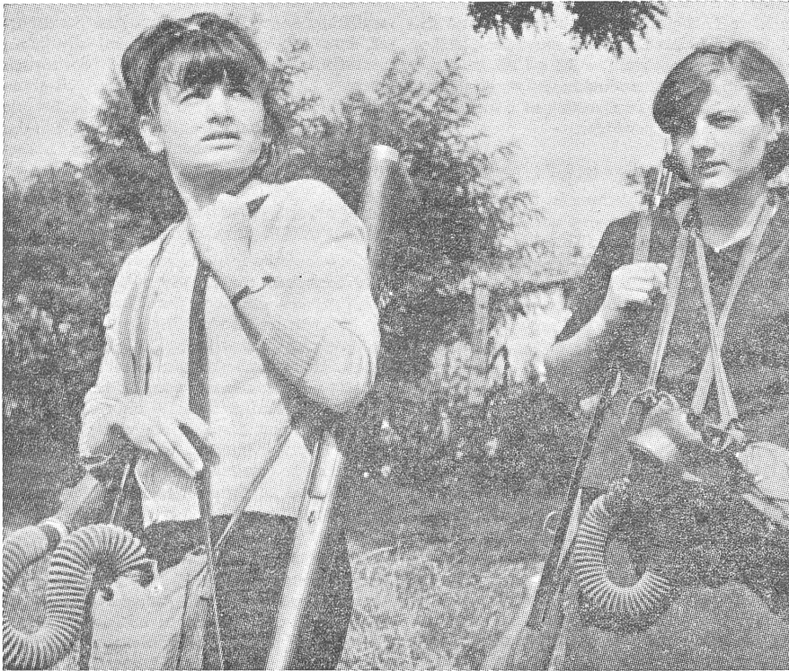
Diese beiden Schülerinnen waren die ersten, die sich diesen Herbst zur neuen «freiwilligen Jugendabteilung» meldeten.

bildung in der Schule ersetzt. Nach Schulabschluss können sowohl junge Männer als auch Mädchen jedes Jahr zu einem militärischen Wiederholungs- und Zusatzausbildungsdienst von 10 Stunden einberufen werden. («Borba», Belgrad, 17. 11. 1968.)