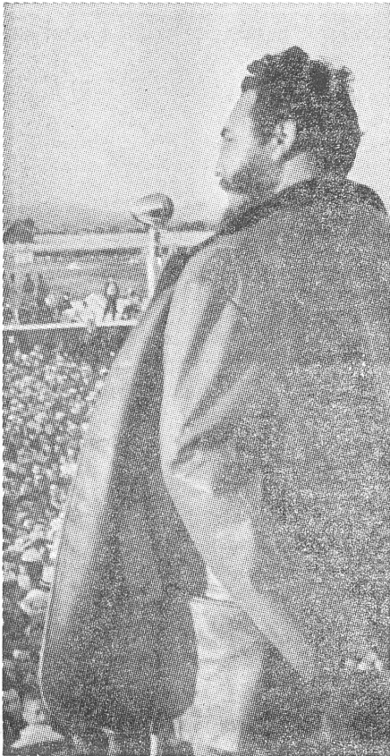
Hier spricht er nicht zu den Fischern, sondern zu den Genossenschaftsbauern.

dient», soll man in gewissen osteuropäischen Regierungen zu sagen pflegen, wie ein Funktionär erzählt hat. Ihrerseits hat die ungarische Presse den Castrismus besonders aufs Korn genommen. Sie liess schon — und gar nicht so verblümt — durchblicken, dass Castro sich von den USA als Werkzeug missbrauchen lasse, um die Einheit der revolutionären Bewegung in Lateinamerika zu sabotieren. Die Sowjets hätten sicher nichts ge-