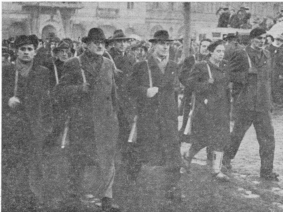
Prag 1948: Mit bewaffneten Milizen als Argumentationsmittel.