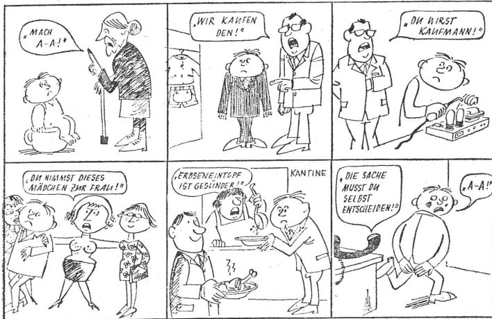
«Die Entscheidung oder ein Menschenschicksal» heisst die Ueberschrift zu diesem Bilderbogen. Wozu sich ergänzen liesse, dass der Staat den DDR-Bürgern noch mehr Entscheidungen abnimmt.