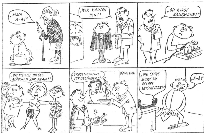
«Die Entscheidung oder ein Menschenschicksal» heisst die Ueberschrift zu diesem Bilderbogen. Wozu sich ergänzen liesse, dass der Staat den DDR-Bürgern noch mehr Entscheidungen abnimmt.