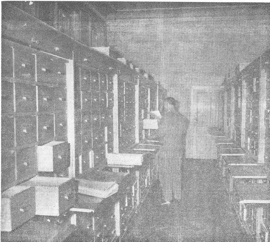
Das Archiv des Staatssicherheitsdienstes in Zagreb. Für Kroatien allein gab es 1,3 Millionen Dossiers.

lich über eine längere Periode hinstreckten und eine Reihe «unabgeklärter» Todesfälle miteinschlossen. Anscheinend bedurfte es der angelauten Säuberung in der Ubda, damit man diese Mordfälle überhaupt zur Sprache bringen konnte.