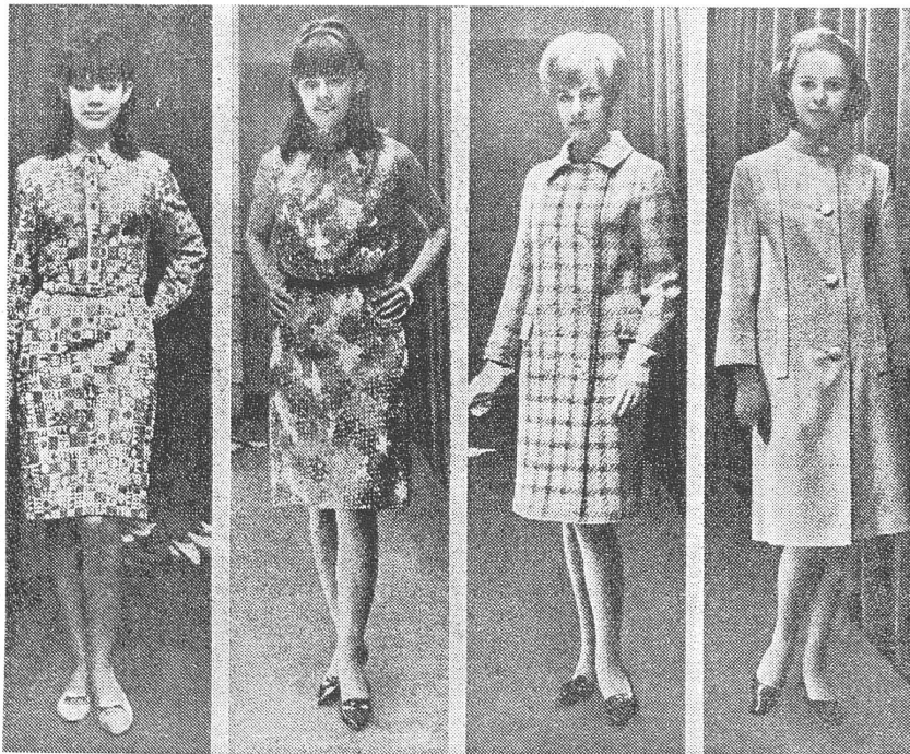
Die Empfehlungen der RGW-Kommission (kurz für Mädchen, lang für Frauen)...

Mode-Behörde für die nächsten zwei Jahre im voraus bestimmt, und bald laufen die Maschinen der Konfektionskombinate heiss, um die zukünftigen Einheitskleidersorgen der Frauen des Sowjetblocks zu lindern. Es wurde für alle Alters- und Grösse-Gruppen der Frauen Vorsorge getroffen. Man hat namentlich die Rocklänge mit Ernst und Gründlichkeit erörtert. Nach den Empfehlungen der Sachverständigen sollen die Jahrgänge unter 20 und bis zur Grösse 48 kurze Röcke über dem Knie tragen. Für Damen über 20 wird die staatliche Konfektionsproduktion dieses gewagte Spiel von sich aus nicht erlauben. Der Rat legte ferner die einheitlichen Modelinien auch für Herren- und Kinderkleider sowie für Textilien, Schuhe, Handtaschen und andere Accessoires fest.