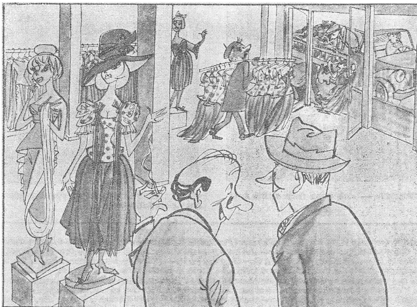
Direktor des Modehauses: «Die neuen Modelle sind angekommen. Das Moskauer Filmstudio hat sie bereits für historische Filmaufnahmen aufgekauft.» («Krokodil», Moskau)

zialistischen Staaten» auch seinerzeit alle im gleichen Zeitpunkt ihre Friedensgesetze erlassen. Im sowjetischen Friedensgesetz, das am 12. März 1951 angenommen wurde, und noch heute Gültigkeit hat, heisst es: