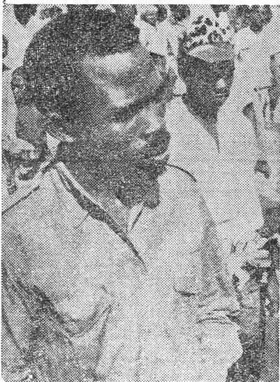
Gaston Soumialot, 45jähriger ehemaliger lumumbistischer Politiker und Propagandist, erklärte 1962 seinen Rückzug aus der Öffentlichkeit. Heute: «Wir haben keine einzige Bedingung zu formulieren, unter der wir unsere Kämpfe einstellen würden. Denn diese sind unsere revolutionäre Schlacht, die nie enden wird. Für uns Revolutionäre gibt es keine Alternative zu unserem revolutionären Programm.»

absolutes Erfordernis ist». Behauptet wird nebenbei, der CNL sei an keine fremde Ideologie gebunden, was wohl als zynisches «bon mot» gelten muss. Denn die Fakten sprechen eine andere Sprache.