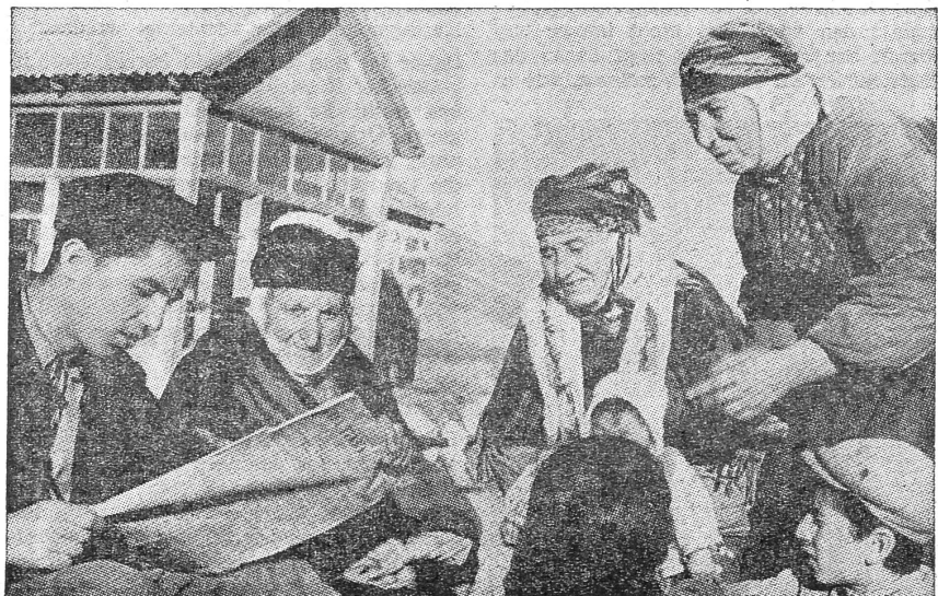
In einem kurdischen Dorf Georgiens liest ein junger Viehzüchter aus der Zeitung vor, die in der kurdischen Minderheitssprache gehalten ist.

Die Wünschbarkeit einer nach Volksgruppen geordneten Struktur für die Sowjetunion braucht gar nicht bestritten zu werden. Es genügt zu wissen, dass sie der zentralistischen Lenkung gegenüber völlig belanglos ist. Lenin unterstützte den Grundsatz: «Autonomie auf Staatsebene, strenge Zentralisierung auf Parteiebene.» Da der Führungsanspruch der Partei in