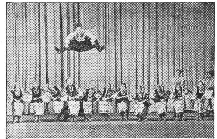
In den einzelnen Unionsteilen werden die alten Nationaltänze nicht mehr geduldet, sondern gepflegt.

Wo kann sich dann die «Autonomie» der Republiken, respektive der autonomen Völkerschaften überhaupt noch ausdrücken? In der Kultur und im Brauchtum. In dieser Beziehung werden denn auch die nationalen Eigenschaften der vielen in der Sowjetunion einbeschlossenen Völker noch einigermaßen geachtet. Neben der russischen Staatssprache ist der freie Sprachgebrauch für die einzelnen Nationalitäten konstitutionell gewährleistet. Zwar macht die «Russifizierung» schon aus den wirtschaftlichen Tendenzen heraus ununterbrochene Fortschritte und wird vom System natürlich nicht gehindert, aber die