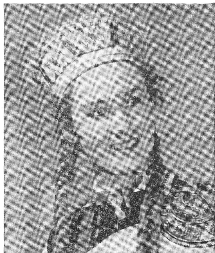
Lettisches Mädchen in der Nationaltracht mit dem traditionellen Kopfschmuck, wie es auf der Volksbühne «Saulgrieci» in Riga zu sehen ist.

Einstellung gewichen. Chruschtschew erwartet von der georgischen Theatertradition oder von den innerasiatischen Volkstänzen ebensowenig einen nationalistischen Umsturz, wie wir vom Trachtenfest. Mit etwas Uebertreibung kann vielleicht angenommen werden, dass die spezifische Kultur der Nationalitäten auf die Ebene des Pittoresken verwiesen wurde, der kostümierten Tradition, des lebendigen Museums und der Touristenattraktion.