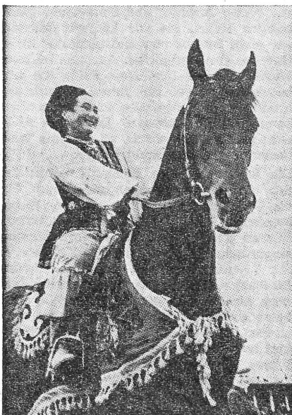
Kasachische Amazone. Die Kasachen mit ihrer mongolischen Hirtenkultur werden von der systematischen Russifizierung des Landes immer mehr zurückgedrängt.

Rolle der Minderheiten als Sprach- und Kulturträger wird kaum direkt unterdrückt. «Chauvinismus» und «Lokalphilismus» werden wohl als politische Gefahr verfolgt, wenn sie sich inhaltlich gegen die Union richten, jedoch geduldet, wenn es um rein formale Belange geht. Inhaltlich hat die Kultur dem «Aufbau des Sozialismus» und dem «Fortschritt» zu dienen, der Ueberlieferung entsprechen. Die stalinistische Gleichschaltung, welche auch die Form auf ein kommunistisches Unionsmass normen wollte, ist einer liberaleren