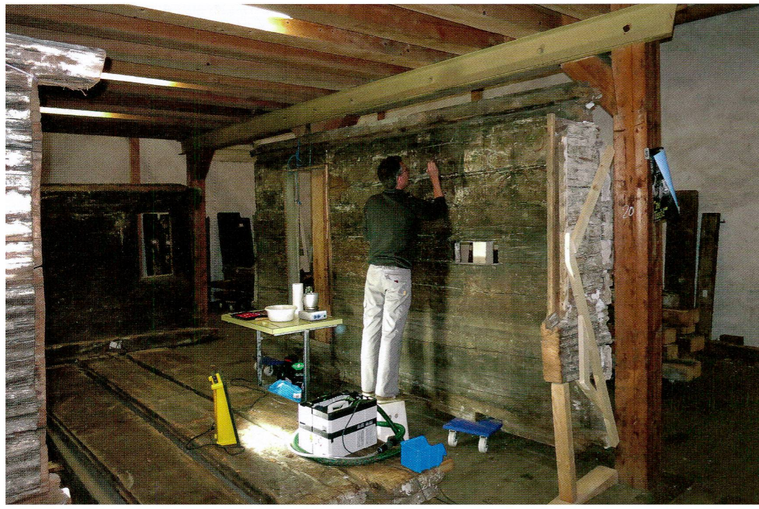
Abb. 2 Festigungsmassnahmen im Depot Arth-Goldau als Vorbereitung für den Transport ins Sammlungszentrum, 2015.