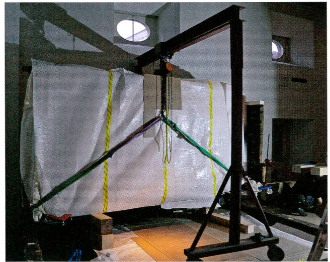
Abb.10 Kranmanöver beim Absenken von Wand D auf den untersten Balken.

Der vorliegende Blockbau ist durch die Ergänzungen und überarbeiteten Verbindungen wieder statisch stabil und selbsttragend, wodurch die Montage gemäss Konzept ausgeführt werden konnte (Abb.10). Das freistehende Wandelement C.1 wurde an eine Lattenkonstruktion montiert, welche die Wand am äusseren Ende mit der Fensterlaibung der Museumshülle verbindet. Dieser Auf-