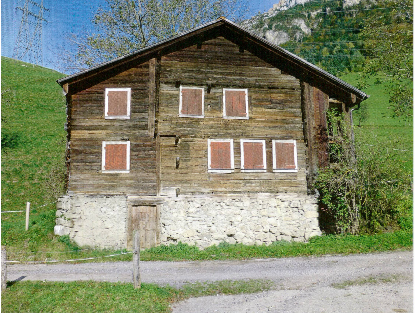
Abb. 4 Morschach, Haus Tannen. Der im Kern 1341 datierte Bau zeigt beispielhaft die charakteristischen Merkmale der mittelalterlichen Bauten in Schwyz.

Sie wurden handwerklich präzise gesetzt und mit Dübeln zusammengefügt. Während sie im Eckverband regelmässig verkämmt sind, treten bei den Innenwänden Einzelvorstösse aus der Aussenwand. Diese Konstruktion ist bis ins 16. Jahrhundert in unterschiedlicher Ausprägung bezüglich Anzahl und Form üblich. 20 Elemente der mittelalterlichen Grundstruktur mit gemauertem Sockel, Stube und Nebenstube auf der talseitigen Giebelfassade wie auch die seitlichen Lauben blieben dagegen für den ländlichen Holzbau in unserem Gebiet über Jahrhunderte hinweg prägend.