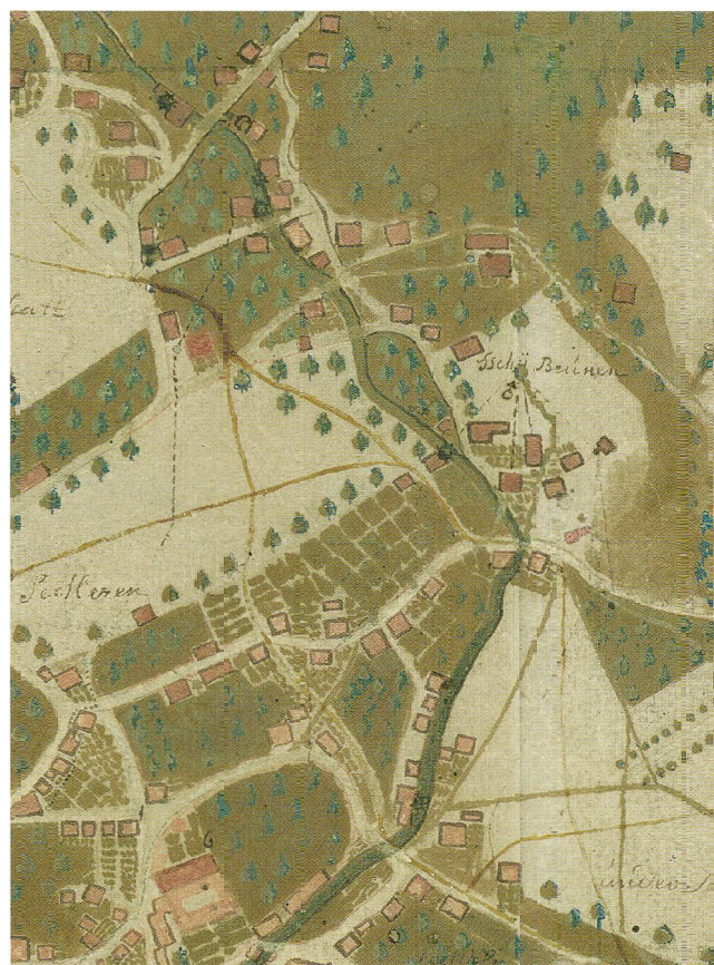
Abb.2 «Grund-Riss von dem Hauptflecken Schwytz», Original von Jost Rudolf Nideröst von 1746, überliefert in der Kopie von Plazidus Hediger von 1784. Ausschnitt Dorfbachquartier mit dem Grundriss des Kloster St. Peter am Bach am unteren Bildrand.

Erstaunlich ist daher an sich weniger die Erkenntnis, dass der Blockbau im Mittelalter etabliert war, sondern vielmehr die Tatsache, dass diese Bauten in Schwyz die Jahrhunderte bis heute überdauert haben. Dies dürfte