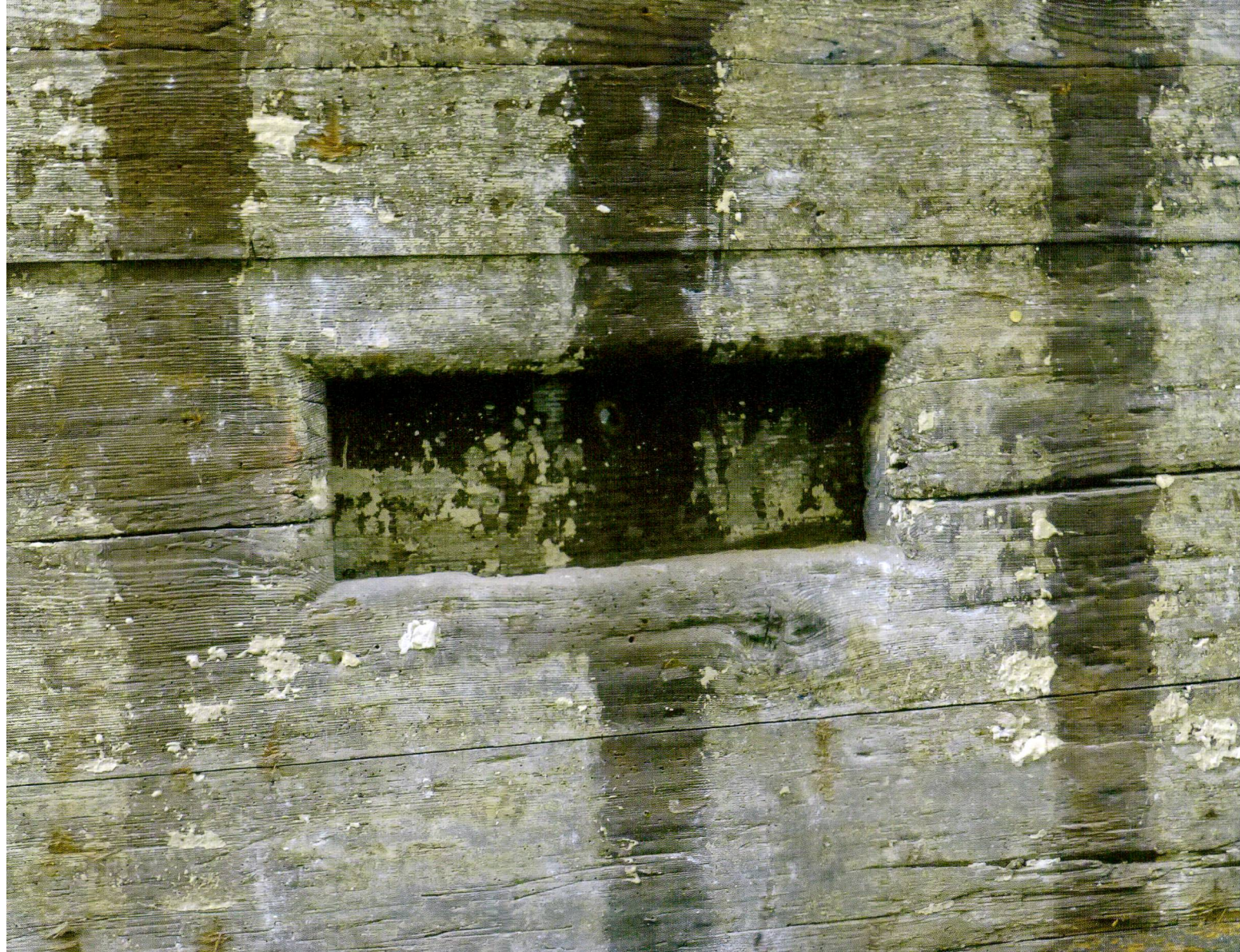
Abb.6 Schwyz, Gütschweg 19. Originale Fensterluke von 1308d mit Schliessladen (nicht vor 1404d).