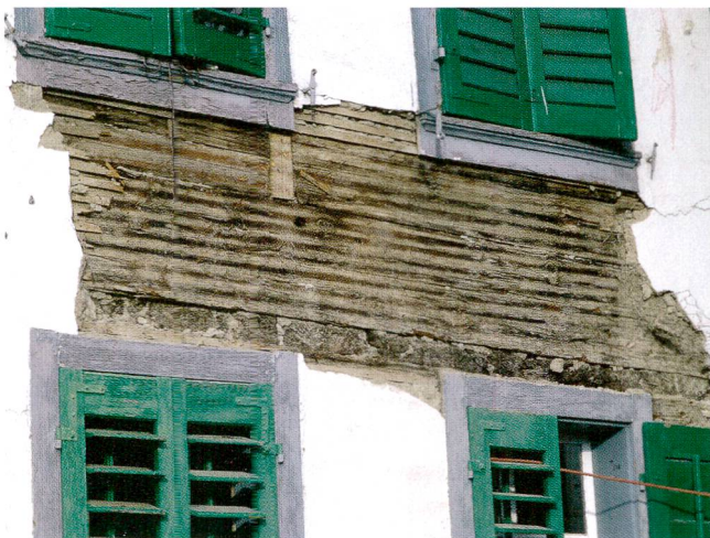
Abb.7 Schwyz, Gütschweg 11. Der punktuell entfernte biedermeierliche Verputz lässt den mittelalterlichen Blockbau von 1311 hervortreten.