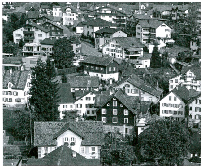
Abb.1 Das Dorfbachquartier von Schwyz in einer Luftaufnahme um 1990. Die Bebauung ist geprägt von klaren, schlichten Baukörpern mit Giebdächern.

bebetrieb begann, endete mit der Entdeckung eines mittelalterlichen Bauensembles am Schwyzer Dorfbach. Dadurch scheint nun der Nachweis erbracht, dass das Dorfbachquartier neben dem herrschaftlichen Zentrum um den Hauptplatz mit Pfarrkirche, Rathaus und Archivturm bereits um 1300 einen Siedlungs- und Entwicklungsschwerpunkt im mittelalterlichen Schwyz bildete. 3