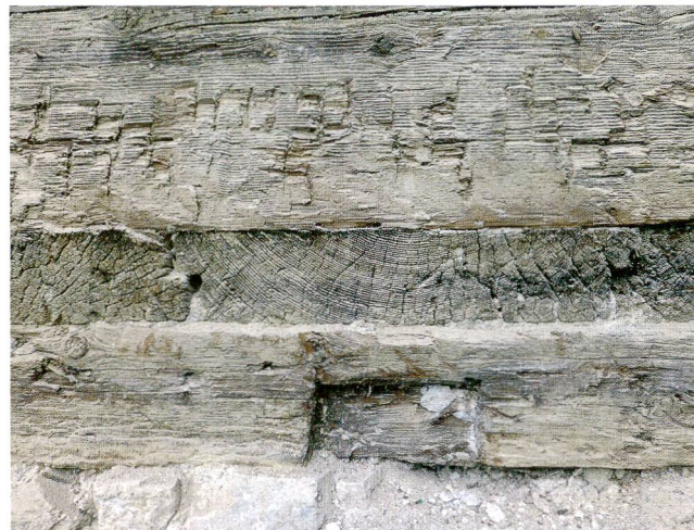
Abb.8 Schwyz, Gütschweg 11. Das Detail der die Fassade durchstossenden Bodenbohle über dem gemauerten Sockel zeigt die handwerkliche Qualität der Zimmerleute in der Zeit um 1300.

Bewohnerinnen und Bewohner sowie zu deren Lebensumständen um 1300 dar – einer Zeit, die in der öffentlichen Wahrnehmung als Gründungszeit der Schweizerischen Eidgenossenschaft gilt.