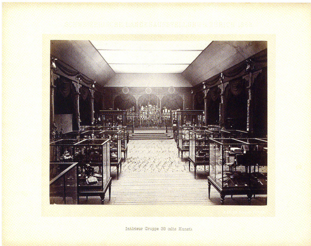
Abb. 1 Schweizerische Landesausstellung in Zürich 1883, Intérieur Gruppe 38 (alte Kunst)