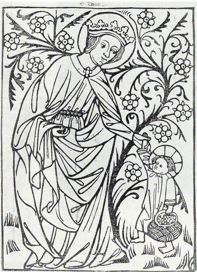
Abb. 2 Heilige Dorothea, Holzschnitt aus einer Handschrift aus St. Zeno bei Reichenhall von 1410, aus: Brockhaus Enzyklopädie, Bd. 8, Wiesbaden 1969, S. 642.