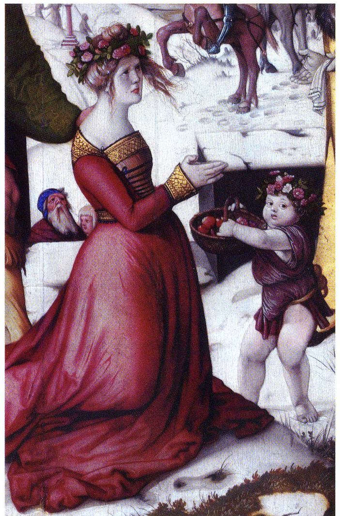
Abb. 3 Ausschnitt aus Hans Baldung Griens Enthauptung der heiligen Dorothea, 1516. Prag, Národní Galerie.