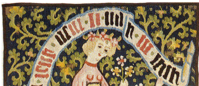
Abb. 6 Über Dorotheas Kopf i.si.na .

Unklar ist zunächst auch, wer mit mir gemeint sein könnte, worauf der Junge mit der Hand verweist. Er selbst kann ja kaum gemeint gewesen sein. Nun ist dieses Wort aber so geschrieben, dass es auch als inir und damit als geringfügige Veränderung des Kreuzestitulus INRI gelesen werden kann.