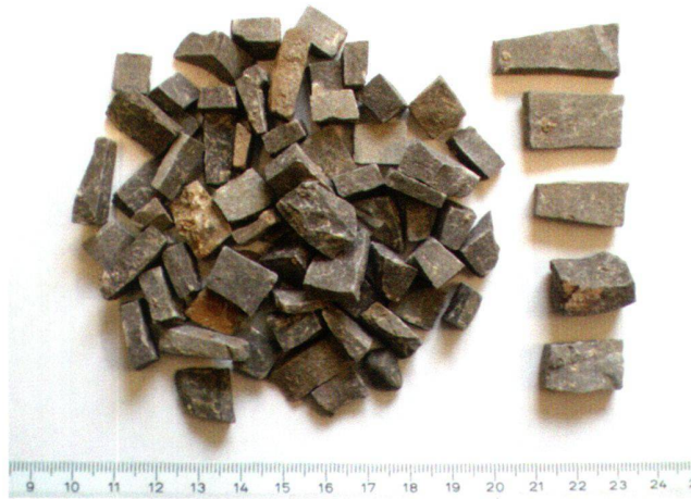
Abb. 5 Auswahl von Mosaikhalbfabrikaten aus der Insula 8. Unter den zirka 3,7 kg Steinsplitter waren viele schwarze Steine vorhanden, die stangen- oder plattenförmig sind. Daneben fanden sich wenige weisse und keine polychromen Steine.