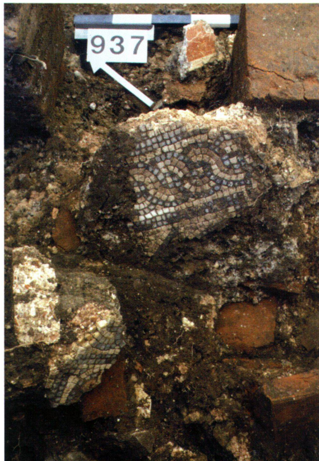
Abb. 6 In einem der hypokaustierten Räume einer palastartigen Domus im Zentrum der Stadt in der Insula 27 fand sich ein stark verstärkter, polychromer Mosaikboden in situ der um 200 n. Chr. datiert wird.