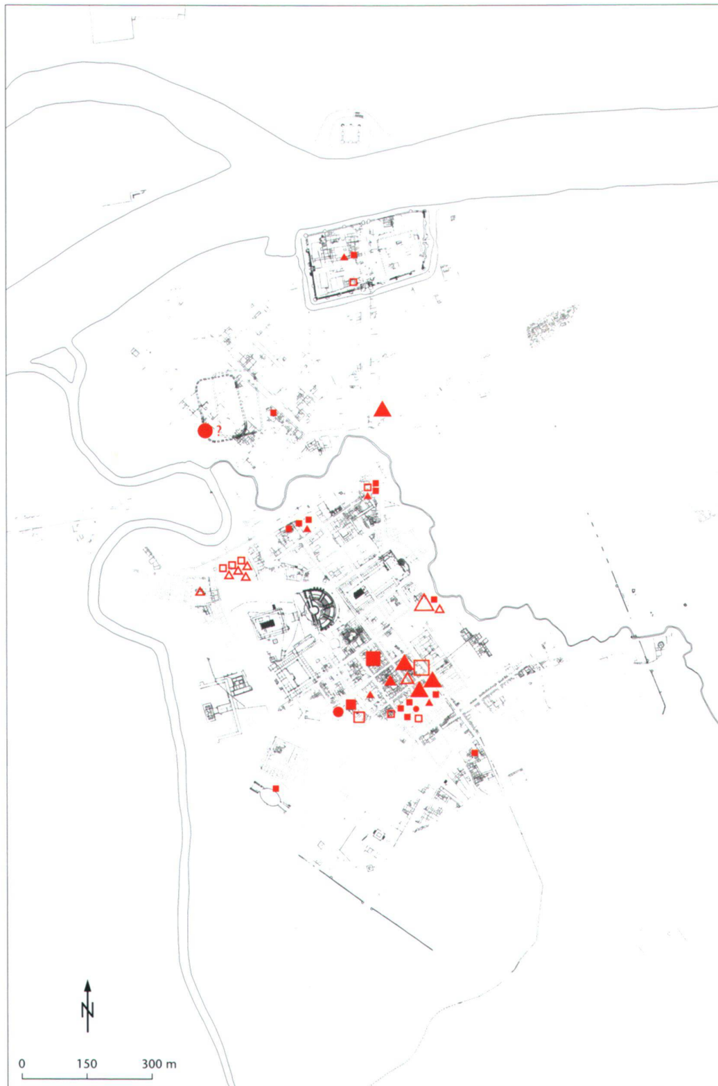
Abb. 3 Die Verbreitung der Glaskuchen, der Glastesserae im Verband eines Mosaiks und der Glastesserae als Einzelfunde in denselben Farben in Augusta Raurica (grösste Symbole: Glaskuchen, mittlere Symbole: Glastesserae im Verband, kleinste Symbole: Einzelfunde. ■ ultramarinblau, ▲ graublau, ● dunkelgrün durchscheinend, □ dunkelgrün opak, △ dunkelgrün, opak).