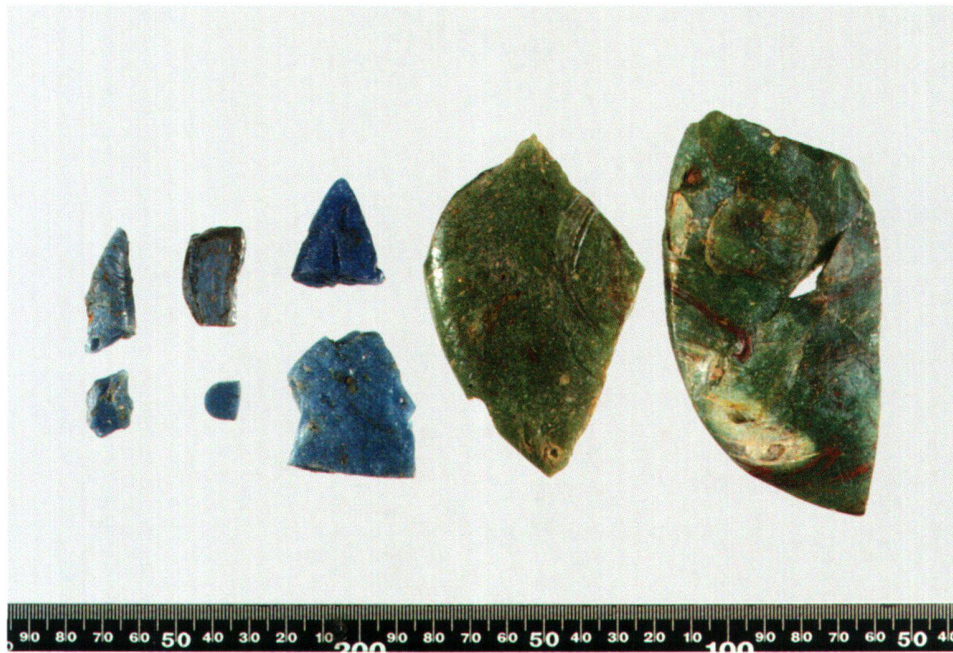
Abb. 2 Beispiele von Glaskuchenfragmenten aus Augusta Raurica. Aus diesen 1–1,5 cm dicken Scheiben wurden die Tesserae aus Glas hergestellt.

Obwohl das gleichzeitige Mosaik polychromes Tesseraematerial aufweist, befinden sich unter den Halbfabrikaten und Steinsplittern aus der Steinsplitterschicht keine polychromen Steine, sondern nur schwarze und weisse Stücke aus einheimischem Kalkstein. 6 Die Mehrheit des Steinmaterials ist weiss und polygonal zugehauen, nur wenige