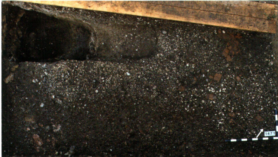
Abb. 7 Im Innenhof des palastartigen Gebäudes in der Insula 27 lag eine bis zu 10 cm dicke und als 3 m 2 Fläche einnehmende Schicht aus Steinsplittern, die sich als Halbfabrikate und Werkstattabfälle eines Mosaizisten interpretieren lässt.