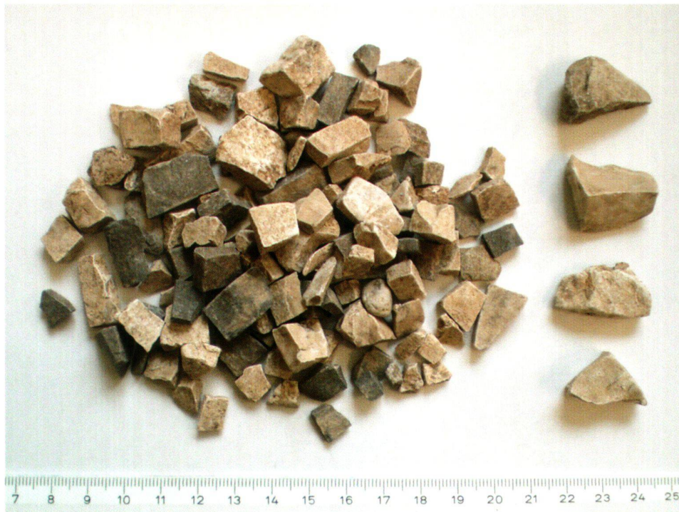
Abb. 8 Die Mehrheit der Mosaikhalbfabrikate aus der Insula 27, die ein Gewicht von zirka 14 kg aufweisen, ist weiss und polygonal zugehauen. Auffällig sind die vielen, sehr kleinen Splitter, die für das Setzen eines Mosaiks nicht mehr zu gebrauchen waren.