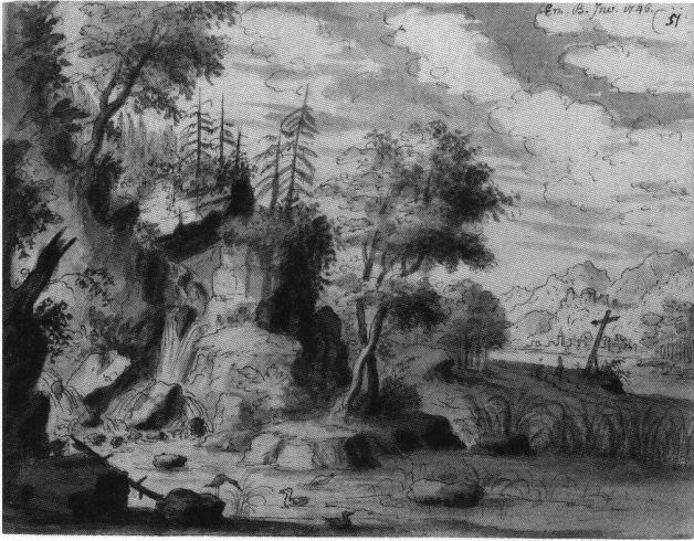
Abb. 15 Landschaft mit Felsen, Wald und Wasserfall links, von Emanuel Büchel, 1746. Feder, Pinsel, laviert. Skizzenbuch A 48 a, fol. 51. Basel, Kupferstichkabinett.