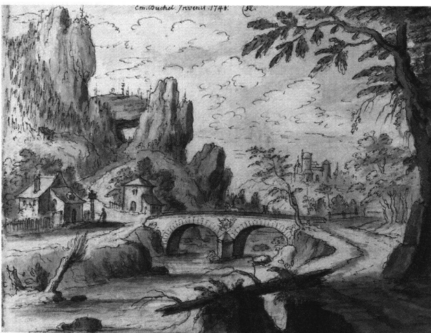
Abb. 17 Landschaft mit steinerner Brücke, Zollhaus und Felsentor links oben, von Emanuel Büchel, 1746. Feder, Pinsel, laviert. Skizzenbuch A 48 a, fol. 52. Basel, Kupferstichkabinett.

herab (Abb. 15), dann wieder fließt dem Betrachter rechts ein Bach über eine Fallstufe entgegen (Abb. 16), einmal wird ein Flusslauf von einer steinernen Doppelbogenbrücke überspannt (Abb. 17), dann wieder spannt sich ein hölzerner Steg von Fels zu Fels (Abb. 18). Es gibt flach schleichende Gewässer im Wald und Seelandschaften im Hintergrund. Manchmal überquert ein Lastenträger eine Brücke, und manchmal bewegen sich flüchtig skizzierte