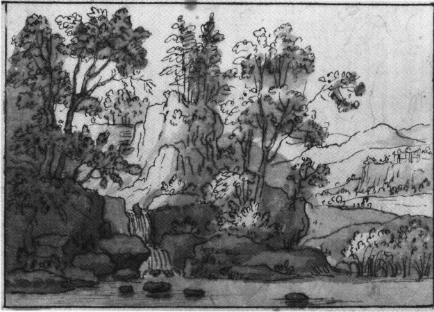
Abb. 9 Flusslandschaft mit Wasserfall über Felstreppen links, von Emanuel Büchel. Feder, laviert. Skizzenbuch A 48 c, fol. 12. Basel, Kupferstichkabinett.