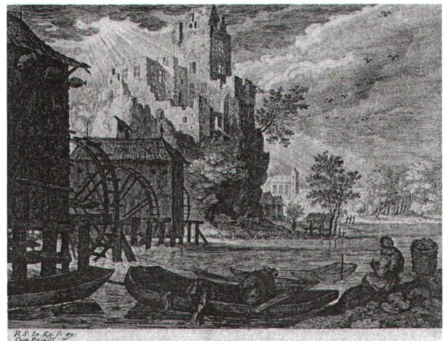
Abb. 8 Wassermühle, von Aegidius II Sadeler (1568–1629), herausgegeben nach einer verlorenen Zeichnung von Roelant Savery (1576–1639). Radierung/Kupferstich. Illustrated Bartsch , Bd. 72, 2, Nr. 251.