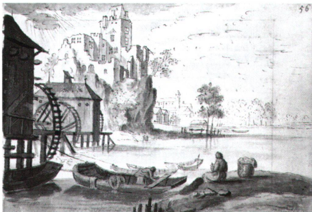
Abb. 7 Flusslandschaft mit Mühlen, von Emanuel Büchel. Feder, laviert. Skizzenbuch A 48 c, fol. 56. Basel, Kupferstichkabinett.

Im gleichen Skizzenbuch A 48 c finden sich mindestens 37 mehr oder weniger freie Kopien nach Radierungen des