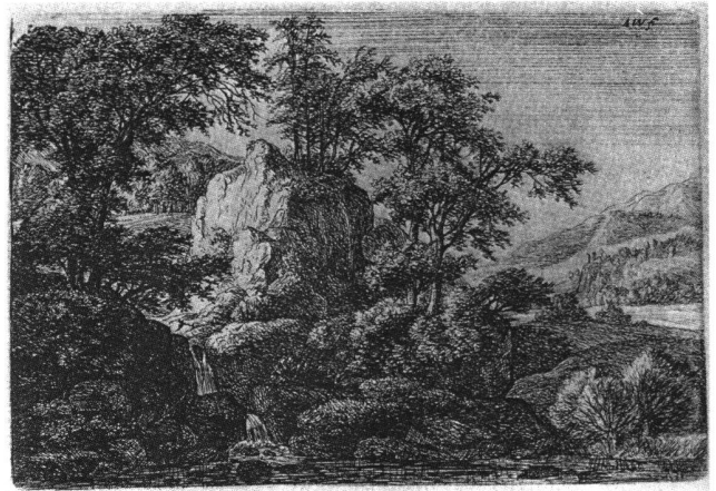
Abb. 10 Die Doppelkaskade, von Anthonie Waterloo (1609–1690). Radierung. Illustrated Bartsch , 2, 2, Nr. 71.

auch von Salomon Gessner empfohlenen und für seine Baumlanschaften berühmten Niederländers Anthonie Waterloo (1609–1690): So steckt zum Beispiel hinter Büchels «Flusslandschaft mit Wasserfall über Felstreppen links» (Abb. 9) Antoni Waterloo's Radierung «Die Doppel-Kaskade» (Abb. 10). 16 Wie alle seine Nachzeichnungen nach Waterloo ist dieses Blatt offensichtlich rasch entstanden und von Büchel weder signiert noch datiert. Die so feinteilige und reich differenzierte Landschaftsschilderung Waterloos ist ziemlich grob vereinfacht und auf das hauptsächlichste Inventar reduziert: Baumgruppen, Felserhebung in der Mitte, Wasserfall und Hauptlinien des Hintergrunds.