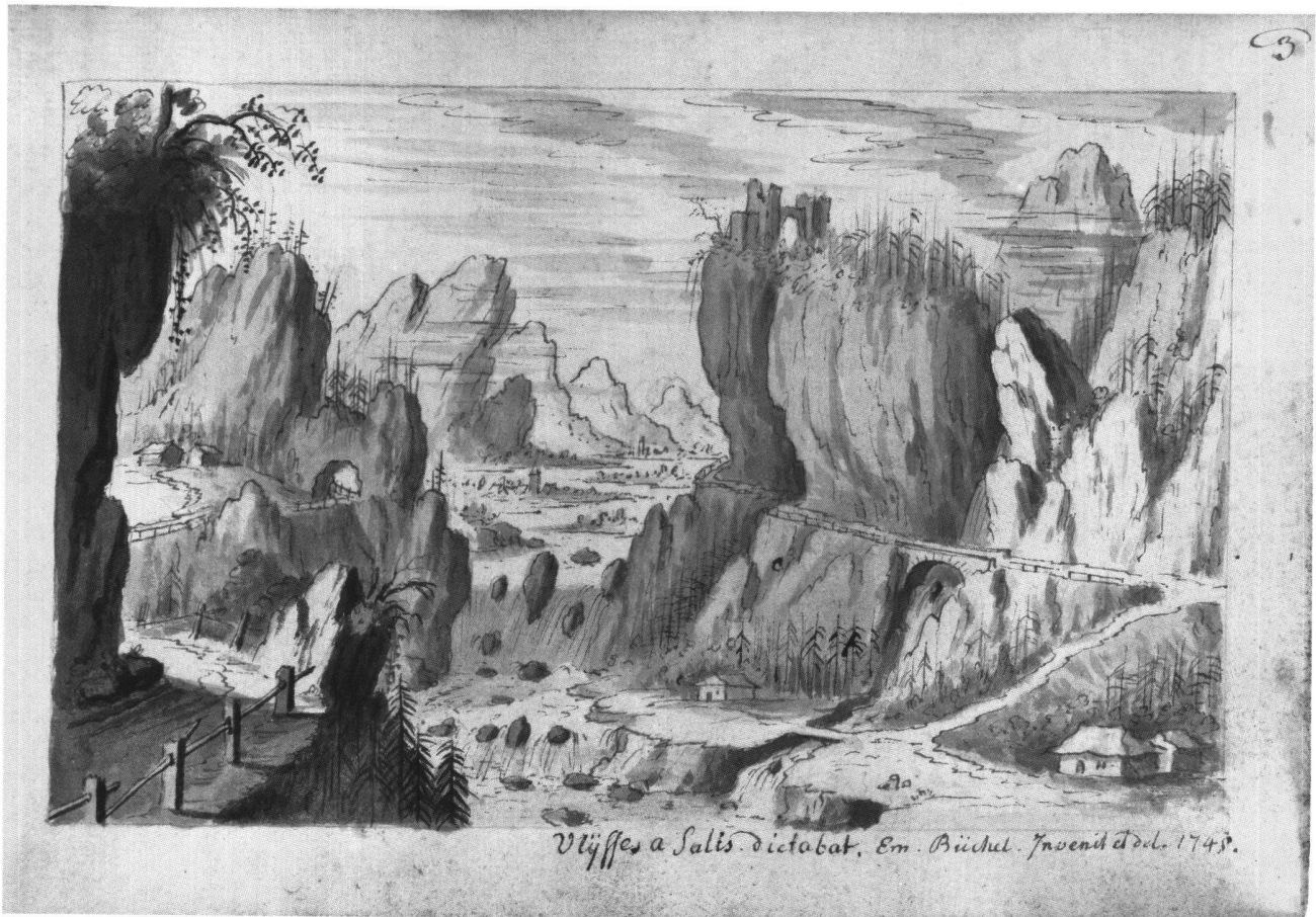
Abb. 13 «Ulÿsſes a Salis dictabat», Gebirgslandschaft mit Felsenstrassen, von Emanuel Büchel, 1745. Feder, laviert. Skizzenbuch A 48 c, fol. 3. Basel, Kupferstichkabinett.

schen Zeichners Carlo Fantassi (1679–1746) genauer umschrieben zu haben. 19 Büchels Zeichnungen mit antikisierenden Ruinenmotiven finden sich als relativ kompakte Gruppe im kleinen Skizzenbuch A 48 d. Da aber nur noch wenige Arbeiten Fantassis überhaupt bekannt sind, ist der Anteil der direkten Übernahmen von Fantassi-Motiven in