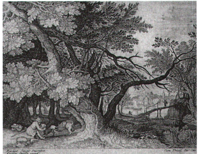
Abb. 6 Waldlandschaft, von Aegidius II Sadeler (1568–1629), herausgegeben nach einer verlorenen Zeichnung von Roelant Savery (1576–1639). Radierung/Kupferstich. Illustrated Bartsch , Bd. 72, 2, Nr. 227.

– etwas vereinfacht – bis in den Hintergrund relativ getreu und grosszügig wiedergegeben. Typisch für Büchel, der nicht primär an Figuren interessiert ist: Sadeler's Staffagegruppe der zwei gelagerten Männer mit den zwei Hunden im Vordergrund links lässt er weg. Die winzigen Figürchen im Hintergrund, den sitzenden Fischer und den Lastenträger auf dem Holzsteg, die in der Verkleinerung zeichnerisch leichter zu bewältigen sind, hat er dagegen aus dem Stich übernommen.