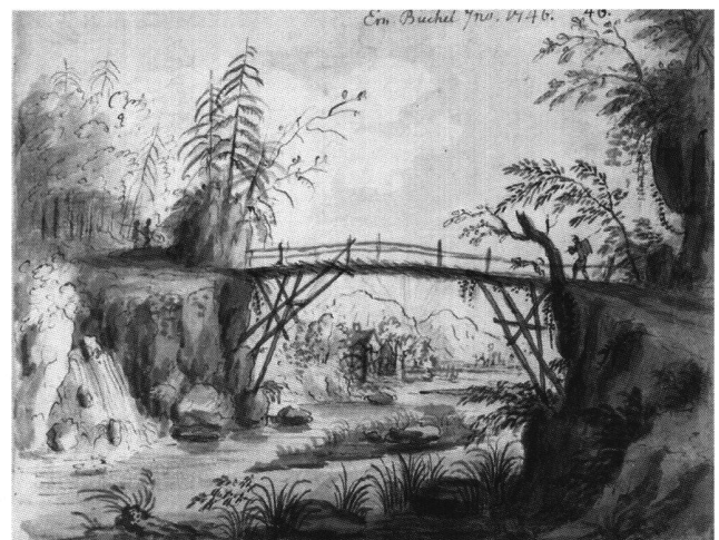
Abb. 18 Landschaft mit Fluss, Holzbrücke und Mühle im Hintergrund, von Emanuel Büchel, 1746. Feder, Pinsel, laviert. Skizzenbuch A 48 a, fol. 46. Basel, Kupferstichkabinett.