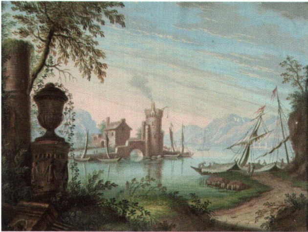
Abb. 1 Seelandschaft mit antiker Vase (Vogler-Folge), von Emanuel Büchel, 1736. Gouache. Gegenwärtiger Standort unbekannt.

Nämlich Meyers «Landschaft mit einer Pyramide links» (Abb. 2), einer Ideallandschaft aus einer Folge von vier Landschaften mit antiken Ruinen. Ebenso ist Büchels «Felsentor mit Wasserfall» (Abb. 3) nach einer Radierung Felix Meyers gezeichnet (Abb. 4). 9