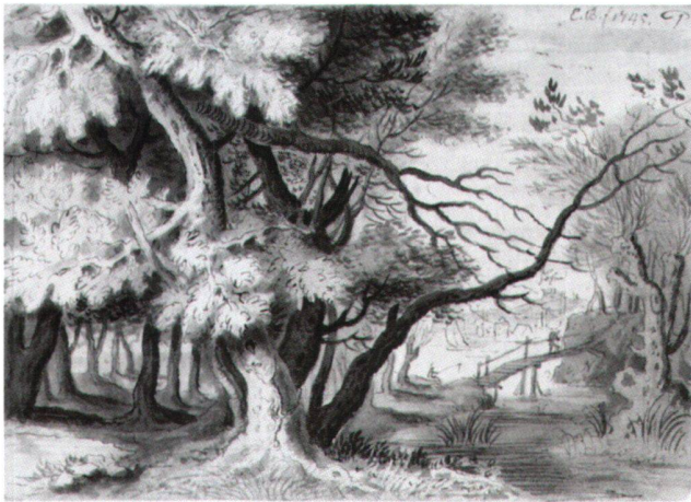
Abb. 5 Baumlandschaft mit See und Holzsteg im Hintergrund, von Emanuel Büchel, 1745. Feder und Pinsel, laviert. Skizzenbuch A 48 c, fol. 1. Basel, Kupferstichkabinett.