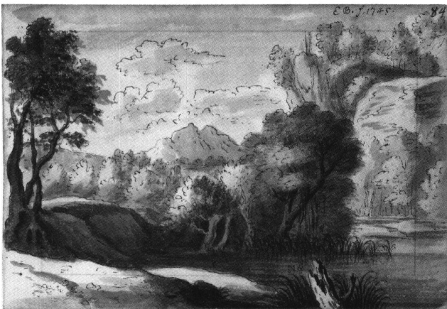
Abb. 11 Flusslandschaft mit Bäumen in felsigem Gebiet, von Emanuel Büchel, 1745. Feder und Pinsel, laviert. Skizzenbuch A 48 c, fol. 84. Basel, Kupferstichkabinett.

lenen Herman van Swanevelt, eines lange Jahre in Paris und in Rom tätig gewesenem Holländers, der 1651 Mitglied der Pariser Académie Royale geworden ist. 17 Während die Nachzeichnungen in A 48 c neutral signiert und datiert («E. B. f. 1745» / «Em. Büchel f. 1745») und mit Bleistiftmarkierungen für einen verkleinerten Bildausschnitt versehen sind, tragen die beiden ziemlich getreuen Kopien in Skizzenbuch A 48 a als grosse Ausnahme einen Verweis auf das Vorbild: «Em. Büchel f. 1745. Schwanefeld. Invent». Freier ist Büchel bei den Kopien in Skizzenbuch A 48 c verfahren: Die Vorlage für seine, mit «E. B. f. 1745» bezeichnete Feder- und Pinselzeichnung «Flusslandschaft mit Bäumen in felsigem Gebiet» (Abb. 11) war Swanevelts Radierung «Landschaft mit einem tanzenden Satyr» (Abb. 12). 18 Büchel lässt in seiner Fassung die Vordergrundsstaffage weg; Figuren-