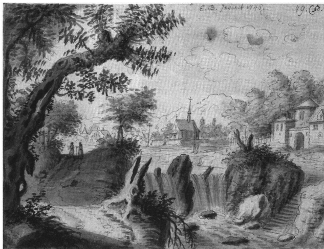
Abb. 19 Landschaft mit Wasserfall, links Weg mit zwei Figuren, von Emanuel Büchel, 1746. Feder, Pinsel, laviert. Skizzenbuch A 48 a, fol. 50. Basel, Kupferstichkabinett.

Staffagefiguren auf eine Wegbiegung zu (Abb. 19). Dorflandschaften und phantastische Schlösser mit rauchenden Kaminen (Abb. 20) gibt es zu sehen, seltener eine Stadlandschaft, Städte sind meist im Hintergrund angedeutet, fast immer aber krönt eine Burg einen Hügel oder eine Insel im Wasser.