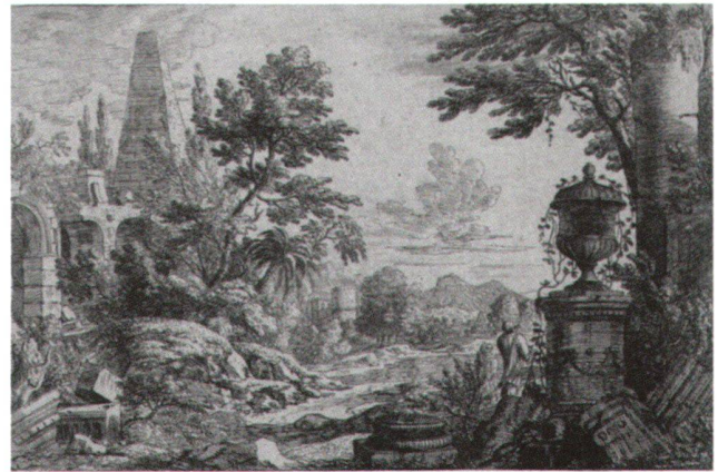
Abb. 2 Landschaft mit Pyramide, von Felix Meyer (1653–1713). Radierung. Zürich, Graphische Sammlung ETH.

tungsgeladenen «heroischen» Landschaften eines Nicolas Poussin (1594–1665) bis zu den meist namenlosen Dekorationslandschaften der Supraporten und Ofenkacheln reicht, ist zwar im unteren Mittelfeld dieser Möglichkeiten zu suchen. 8 Aber gerade dieses oft vernachlässigte Segment der Kunstproduktion erlaubt Einblicke in das Verhältnis des Kunstangebotes zur Kunsterwartung eines im 18. Jahrhundert rasch breiter werdenden Publikums.