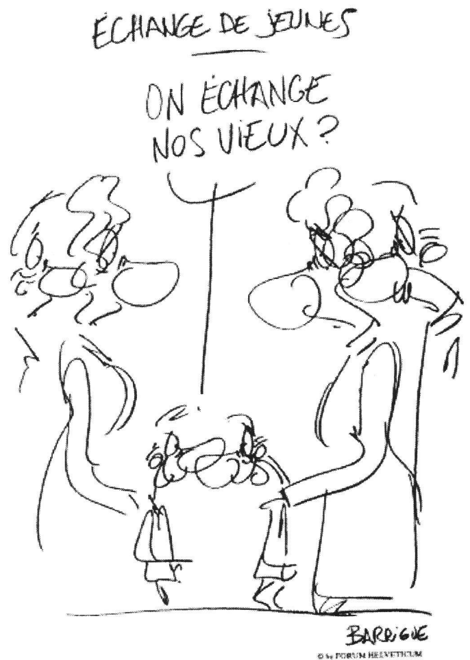
Fig. 2 L'échange de jeunes vu par le dessinateur Barrigüe.

tion de priorités à définir dans le domaine de la formation des jeunes. Or, dans un pays officiellement quadrilingue et uni par une volonté politique commune cette formation a un rôle fondamental à jouer en vue de la cohésion nationale.