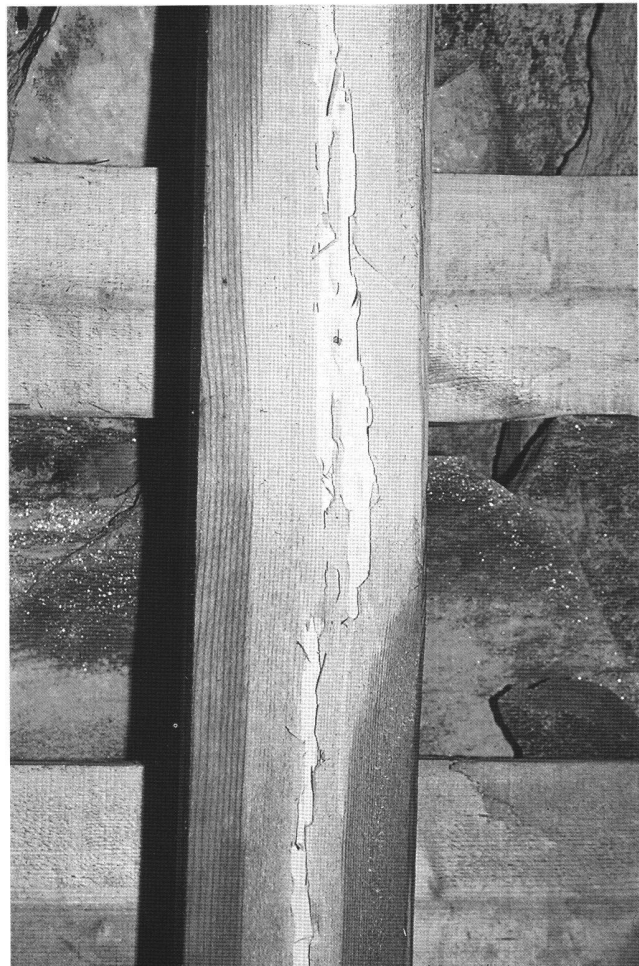
Fig. 1 Correntino del tetto della chiesa di Mairengo (Ti) con le gallerie scavate dal capricorno ( Hylotrupes bajulus ), un parassita che attacca esclusivamente il legname delle conifere.

La figura 2 mostra una casa costruita negli anni '30 a Mosogno. Sono ben visibili le macchie e le efflorescenze saline che si sono formate sull'intonaco, eseguito appena alcuni mesi prima. Nella convinzione di risolvere i problemi legati alla risalita capillare, il rifacimento dell'intonaco era stato preceduto dalla posa di una zoccolatura in sasso e dall'eliminazione di due aiuole che si trovavano a ridosso della casa.