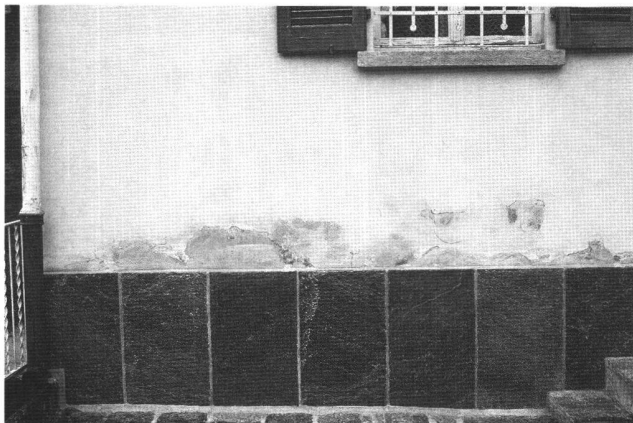
Fig. 2 Casa unifamiliare a Mosogno (Ti): tutti gli interventi eseguiti per frenare la risalita capillare hanno ottenuto il risultato opposto.

osservare come su edifici situati a poche centinaia di metri dal primo si ripetessero man mano gli stessi identici tentativi e si ottenessero i medesimi risultati.