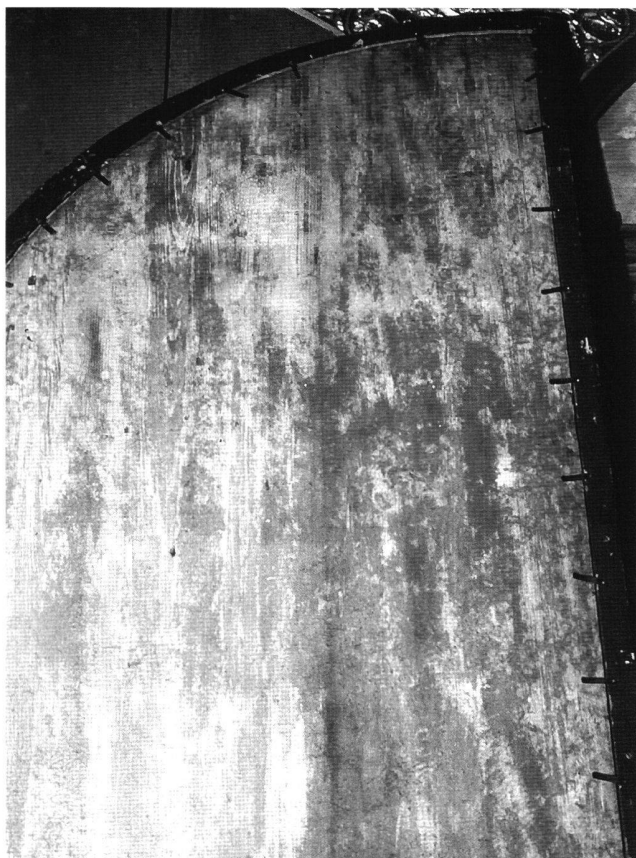
Abb. 6 Rückseite der Geburt Christi mit Resten eines weissen Anstrichs oder der ursprünglichen Grundierung.

offenliegenden Wurmfrassgänge oder Sägespuren, die auf eine spätere Abarbeitung, Glättung oder Spaltung hinweisen. Die einzelnen Bretter sind makellos verleimt und weisen weder Sprünge noch Risse auf; auch ist die Tafel nur geringfügig verwölbt. Offensichtlich war bereits bei der Auswahl des Holzes auf höchste Qualität geachtet worden. Da es keinerlei Anhaltspunkte für eine nachträgliche Bearbeitung der sorgfältig geglätteten Rückseiten gibt,