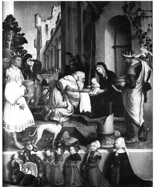
Abb. 3 Anbetung der Könige mit den weiblichen Familienmitgliedern des Stifters, Ausschnitt aus dem Oberried-Altar.

restaurieren. 3 1960 schliesslich kamen sie nochmals kurz nach Basel zurück und waren auf der grossen Holbein-Ausstellung zu sehen.