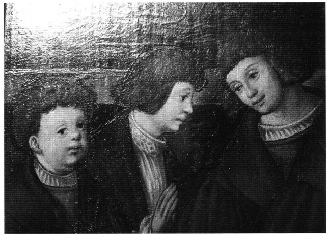
Abb. 7 Die Enkel in der Geburt Christi, Streiflichtaufnahme.