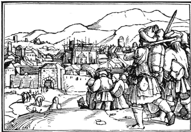
Abb. 11 Rückkehr der Juden nach Jerusalem, von Hans Holbein d. J., um 1526/28. Holzschnitt aus den «Icones». Basel, Öffentliche Kunstsammlung, Kupferstichkabinett.

men von jener merkwürdig verschatteten Säulenfigur in der Geburt oder jenem geckenhaft gekleideten Höfling in der Anbetung (Abb. 2), diese auch immer wieder im Detail abgebildet, sich aber nicht weiter mit ihnen beschäftigt. So wird die in ein dünnes, langes Hemd gekleidete, in den Sternenhimmel blickende Säulenfigur nur lapidar als antike Göttin bezeichnet. Ausser den auf ihren gewölbten Bauch gelegten Händen, welche wohl eine Schwangerschaft andeuten sollen, und dem neben ihr emporranken- den Efeu ist sie ja auch nicht weiter ausgezeichnet. Bleibt