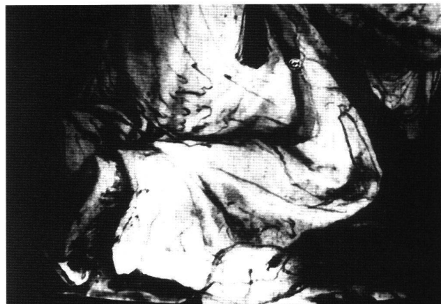
Abb. 4 Die Unterzeichnung im Gewand des knienden Königs der Anbetung, Infrarotreflektographie.

Ornamentfüllungen: Wie die Infrarotreflektographie zu Tage brachte, waren diese Pfeiler zunächst als Rundsäulen angelegt, bevor sie ihre heutige Gestalt erhielten (Abb. 5). Die in diesen Partien auftretenden Schwundrisse belegen neben der durchgängig einheitlichen Lumineszenz der Oberfläche im UV-Licht, dass es sich hier jedoch nicht um eine Veränderung aus späterer Zeit, sondern um eine Korrektur noch im Werkprozess handelt.