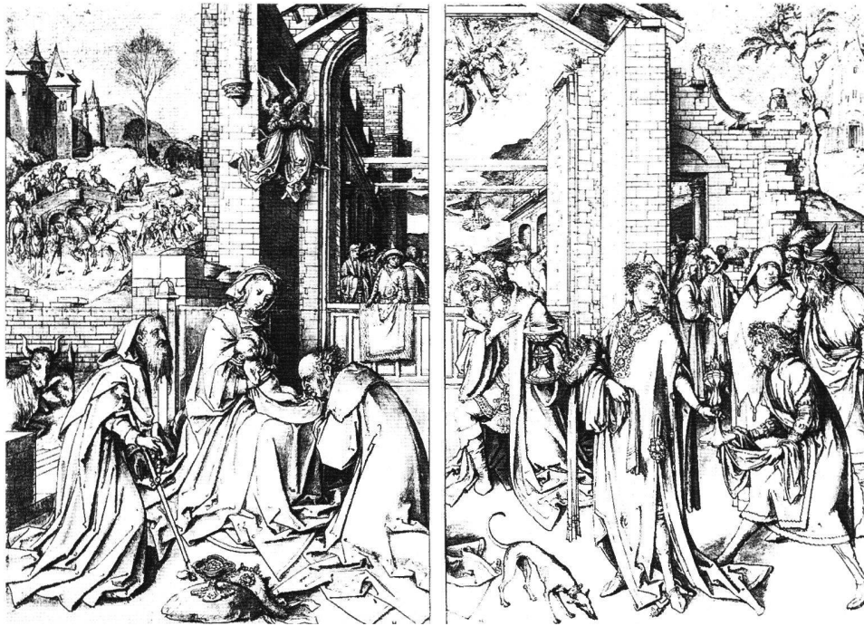
Abb. 10 Anbetung der Könige, von Hans Holbein d. Ä., um 1505. Basel, Öffentliche Kunstsammlung, Kupferstichkabinett.

organisiert. Indem er die Hauptfiguren auf einer zum Bildmittelgrund hin abfallenden Bühne anordnet, aus dem das Gefolge der Könige erst emporsteigen muss, bedient sich Holbein eines Kunstgriffs, den er in dieser Konsequenz erstmals in den «Icones» anwendet (Abb. 11), um Raumtiefe zu evozieren, wohingegen der in der Tiefe verschwindende Zug in der Kreuztragung der Basler Passion lediglich frühe Vorstufe bleibt. Ähnliches gilt für die antikisie-