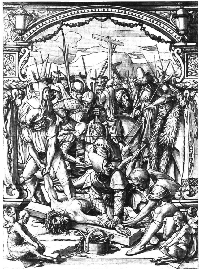
Abb. 9 Annagelung Christi, Scheibenriss zur Passion Christi, von Hans Holbein d. J., um 1528. Basel, Öffentliche Kunstsammlung, Kupferstichkabinett.

neigte Kopf des Halbartenträgers am linken Bildrand der Anbetung (Abb. 8) deutlich, der uns nicht nur im Abendmahl, sondern auch im linken Schergen in der Kreuzanagelung der Scheibenriss-Passion beinahe wörtlich wieder begegnet (Abb. 9). 22 Ferner können die beiden mit durchgebogenem Kreuz, in strengem Profil gezeigten Töchter Oberrieds mit ihrem Kopfputz durchaus an die Seite der 1528 überarbeiteten Tochter auf der Darmstädter-Madonna gestellt werden, auch wenn die Behandlung des Gewands schematischer bleibt. Und schliesslich steht das