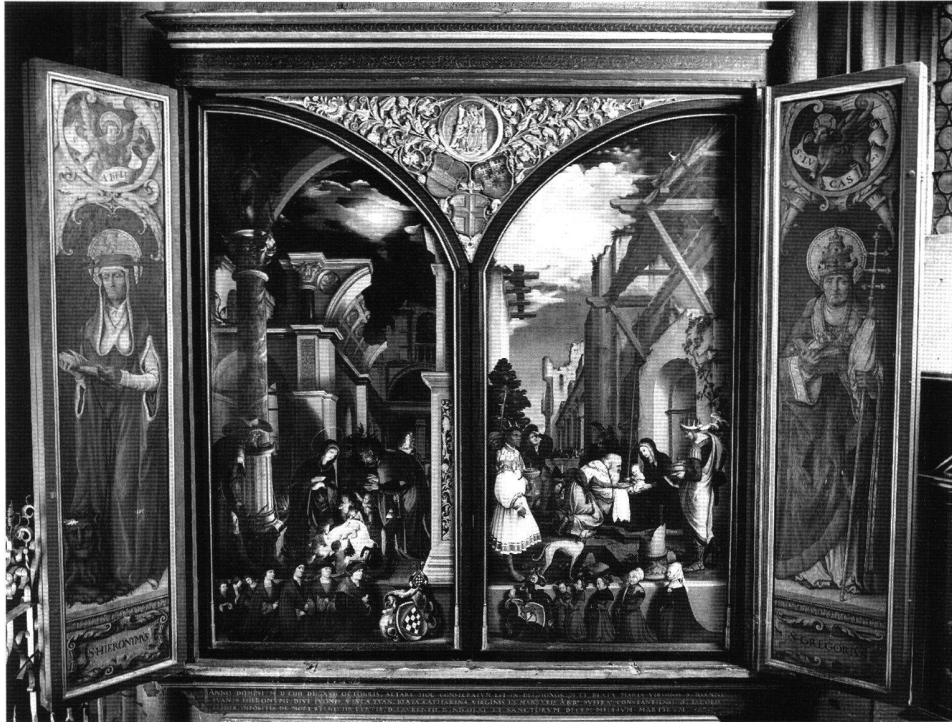
Abb. 1 Oberried-Altar, Anordnung von 1554 mit den unvollendeten Flügelbildern Hans Holbeins d. J. im Zentrum des neugeschaffenen Flügelretabels. Freiburg im Breisgau, Universitätskapelle des Münsters.

Als Kaiser Rudolf II. im November 1596 das «berühmte» und «gar kunstreiche gemälde» Hans Holbeins in der Universitätskapelle des Freiburger Münsters (Abb. 1 und Tafel 5) zu erwerben beehrte, erhielt er zur Antwort, dass «die tafel sehr klein, schlecht unvolkommen, und allein von zweien fliglen, von andern orten aus der luterei vor vil iaren gebracht und durch ein fürnähme person zu ewiger gedächtnis seines geschlechts in beruörte capell vergelbet worden» sei. Die Universität könne die Tafel folglich nicht veräussern; ausserdem gäbe es andernorts «volkomne, ganze und köstlichere malwerk», die dem Kaiser sicherlich besser gefallen würden. 1