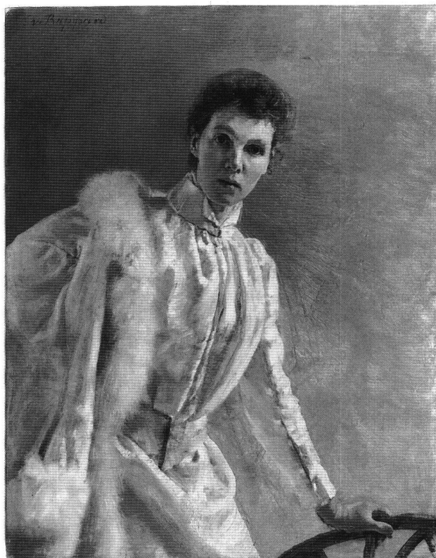
Abb. 2. Selbstbildnis, Öl/Lw., 97×76,5 cm, 1890. Bern, Kunstmuseum.