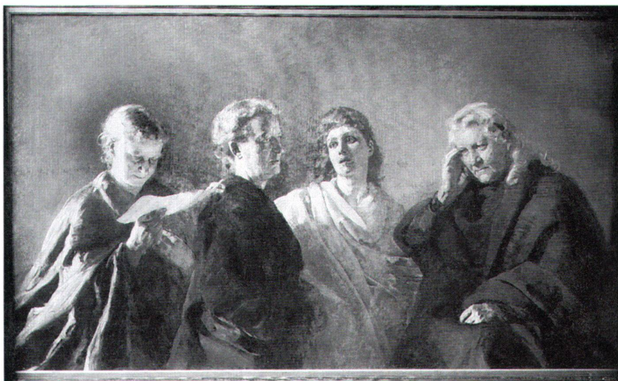
Abb. 9 Sibyllen, 1890, verschollen.

Auf heutige Sehgewohnheiten wirkt diese Darstellung fremdartig, wenn nicht sogar theatralisch. Dem Stil der «Seele Brahmane» folgten noch fünf weitere Arbeiten, die uns die Bildabsicht Rappards näher bringen. «Der Traum» von 1886 (Privatbesitz), «Erzengel» von 1886, «Phantasie. Lebensrätsel» von 1890 (Abb. 8), «Licht und Schatten» von 1896 (alle im Besitz des Kunstmuseums Bern) sowie die verschollenen «Sibyllen» von 1890 (Abb. 9) zeigen stets