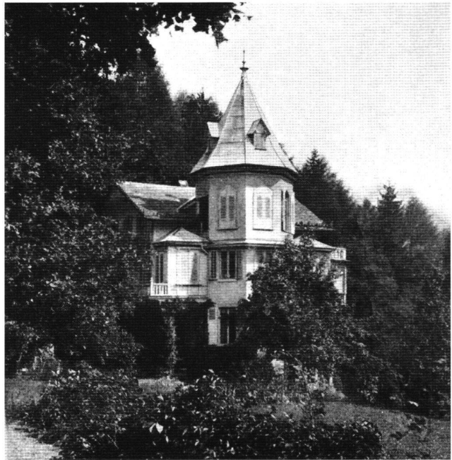
Abb. 12 Die Villa Rugen, undatiert, Schwarzweissfotografie. Privatbesitz.