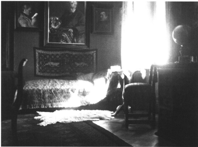
Abb. 3 Salon der Villa Rappard, undatiert, Schwarzweissfotografie. Privatbesitz.

flach und starr gezeichnet wirkt ihr heute verschollenes Jugendbildnis, 34 betrachtet man die Darstellungen aus der Zeit nach 1875. Die Gesichter, wie auf dem Bildnis «In Trauer» (Privatbesitz) oder auf dem Selbstbildnis von 1890 (Abb. 2) im Besitz des Kunstmuseums Bern sind von ausgeprägter plastischer Wirkung, die die Künstlerin mit feinem, dichten Farbauftrag erzielte. Die weich ineinander-übergehenden Farbfelder werden von Licht- und Schatteneffekten noch einmal rhythmisiert. Nur die Gesichter und Hände haben diese sorgfältige Farbbehandlung, Kleidung und Umraum sind viel gröber und flächiger wiedergegeben.