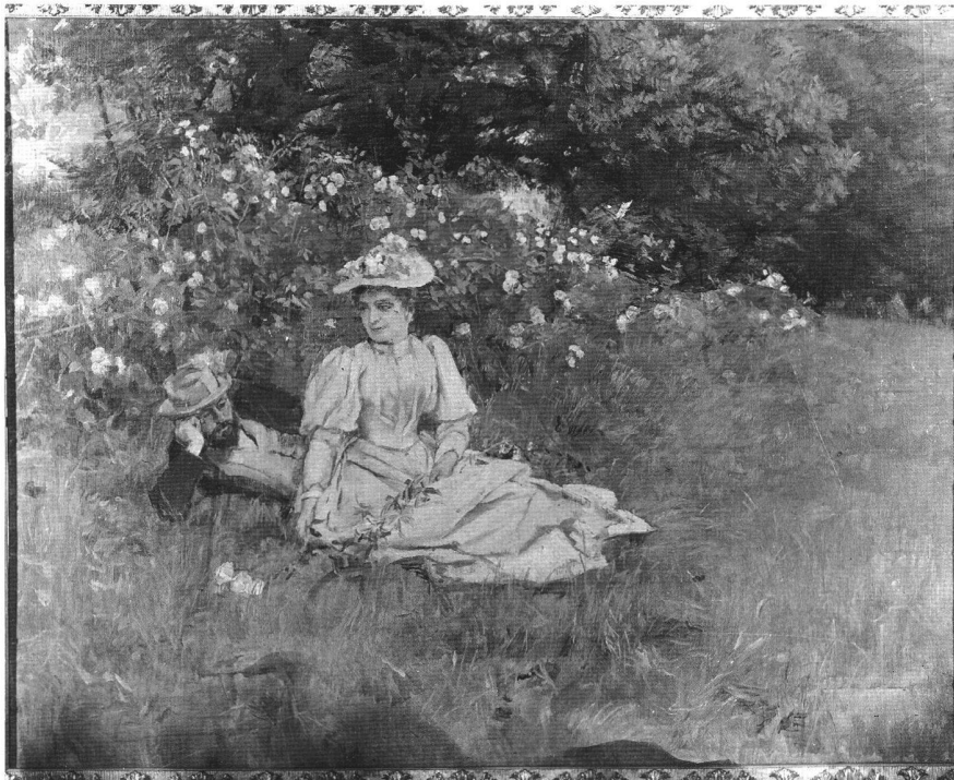
Abb. 6 Das Ehepaar unter Rosen, Öl/Lw., 59,3×77,8 cm, 1886. Bern, Kunstmuseum.