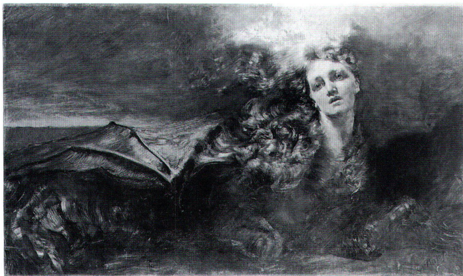
Abb. 7 Seele Brahmane, Öl/Lw., 80,5×139 cm, 1885. Bern, Kunstmuseum.

Seltsame Mischwesen und zum Leben erweckte Gegenstände, wie sie die Novellen der Romantiker Poe, Hauff, de la Motte-Fouqué und Gotthelf bevölkern, bestimmten auch die Vorstellungswelt der jungen Künstlerin. Nicht nur schrieb sie selbst romantische Geschichten, 53 auch die Naturschauspiele der heimischen Gebirgsgegend boten ihr phantastische, irrealer Erlebnisse. Auf einer Bergtour sah sie sich selbst als «Nebelgespenst», als Schattenwurf auf