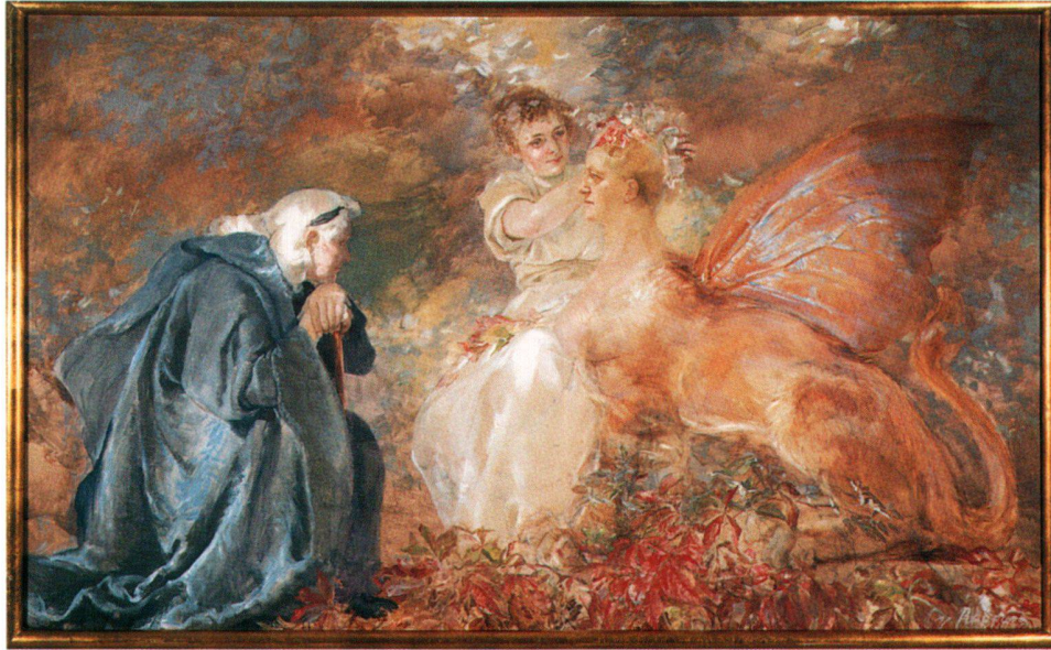
Abb. 8 Phantasie. Lebensrätsel, Öl/Lw., 150,8×251,5 cm, 1890. Bern, Kunstmuseum.

einer Nebelwand: «... plötzlich sah ich mich dort riesengross in einem Strahlenkranz von Regenbogen gehen. Ich machte die anderen aufmerksam, die sich auch bald sahen. Das erste Nebelgespenst, was ich sah». 54