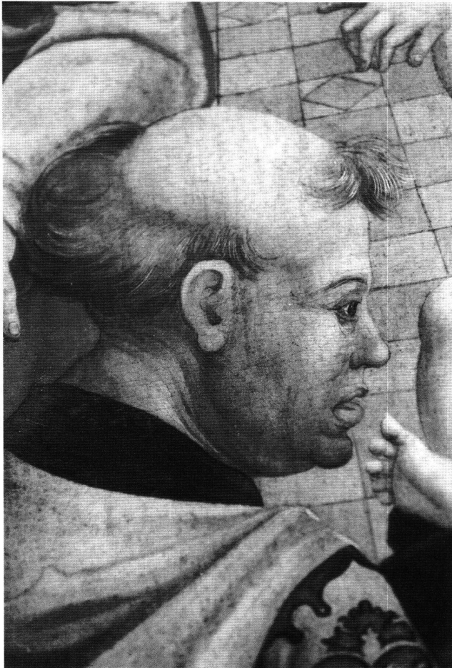
Fig. 4 Mohel, détail de la Circoncision du maître-autel de Lautenbach, du peintre du maître-autel de Lautenbach, vers 1504-05. Eglise paroissiale de Lautenbach/Renchtal.

Au-delà de ces particularités stylistiques de l'école haut-rhinoise – que l'on songe aux portraits sur la Mort de saint Dominique par le peintre du retable de ce nom, un artiste strasbourgeois supposé être le maître de Durer à son passage à Strasbourg 2 –, on admire l'unité de cette personnalité qui transparaît dans l'ensemble du tableau et dans l'expression du visage. Celui-ci dévoile un penseur, mais aussi un homme d'action conscient des réalités de la vie. Celles-