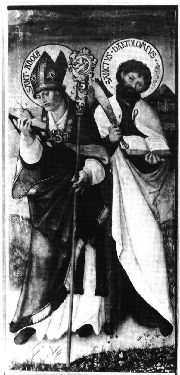
Fig. 3 Saint Adolphe et Saint Bartholomé, volet du retable de Müllenheim, du peintre du maître-autel de Lautenbach, 1514. Strasbourg, Musée de l'Oeuvre Notre-Dame.

- la fourrure naturelle aux poils divergents par touffes, tantôt individualisés dans la lumière et l'ombre, tantôt plus compacts comme sur la cape en poils de chameau de saint Jean-Baptiste sur le volet de Boston ou sur le revers d'her-