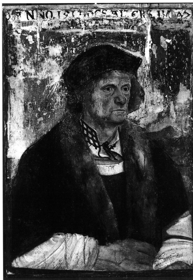
Fig. 1 Portrait d'un homme dans sa soixante-douzième année (Johannes Amerbach?), attribué au peintre du maître-autel de Lautenbach, 1513. Tempera sur parchemin tendu sur bois, 52 cm × 36 cm. Bâle, Öffentliche Kunstsammlung (Inv. n° 671).

Le portrait d'un homme de 71 ans présente un personnage de trois-quart occupant toute la hauteur du tableau dont le fond de ciel bleu pâle est ruiné. Il est habillé avec richesse, coiffé d'une toque à la mode et revêtu d'une pèlerine brune à col de vison, un habillement dans lequel aimaient se faire portraitiser beaucoup de personnages de l'époque. La blouse blanche au col haut négligemment lacé et entr'ou-