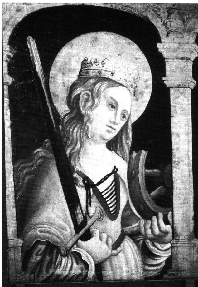
Fig. 2 Sainte Catherine, détail du retable des Douleurs, du peintre du maître-autel de Lautenbach, 1523. Eglise paroissiale de Lautenbach/ Renchtal.

raison de son décès à Noël 1513... Cette main, certes difforme, n'est pas coutumière au peintre du maître-autel de Lautenbach. Sous la pèlerine et sur la blouse un pourpoint noir est galonné de blanc, d'où dépasse encore un tissu rouge vermillon, note de fantaisie et de gaieté dans un ensemble plutôt sévère.