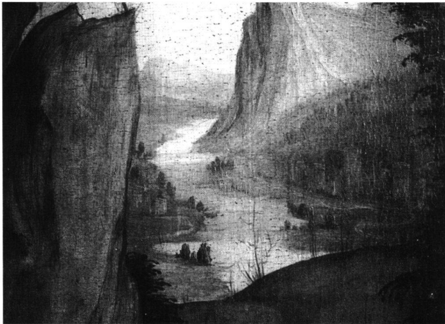
Fig. 6 Paysage, détail de la Visitation du maître-autel de Lautenbach, du peintre du maître-autel de Lautenbach, vers 1505–11. Eglise paroissiale de Lautenbach/Renchtal.

Cet homme riche n'est pas un aristocrate mais bien plutôt un bourgeois dont la classe a beaucoup suscité l'art du portrait. Il a acquis son rang social grâce aux valeurs de courage et de ténacité à la tâche qui étaient celles de son milieu aux XVe et XVIe siècles 3 . Il est parvenu à la fin de ses jours à une aisance matérielle qui lui permet de contempler sa vie avec une conscience de soi tranquille. Cette tranquillité se remarque à la main abandonnée, entr'ouverte, aux traits du visage détendu, sans apprêt.