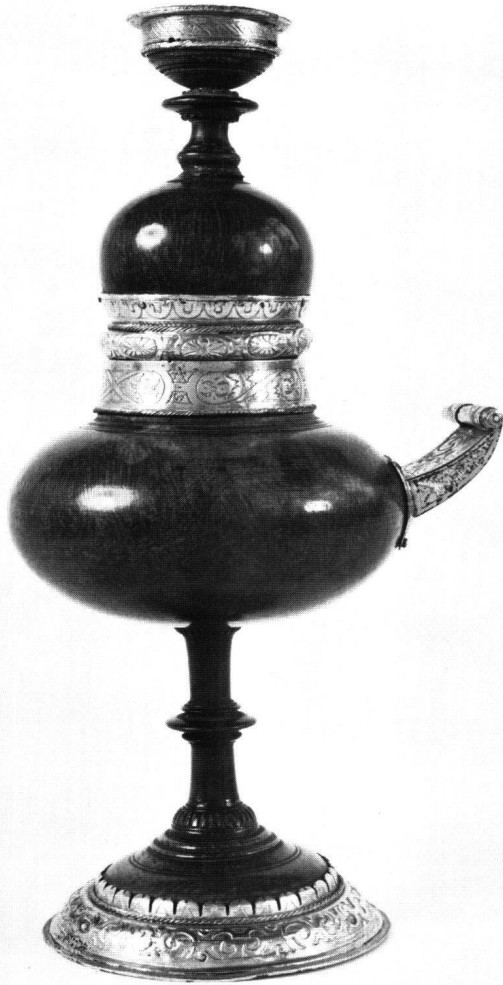
Abb.1 Bruder-Klausen-Becher. Höhe 27,5 cm. 15., 16. und 19. Jahrhundert. Stans.

mann und 1786 zu den Traxler. Tradition, Wertschätzung und Besitzerstolz sorgten 200 Jahre für den sicheren Verbleib des Bechers in Nidwalden. 1762 erklärte Ritter und Hauptmann Johann Karl Achermann den Becher zum Fideikommiss. 8 Die ergänzende Bestimmung, im Falle fehlender Familienerben den Becher dem Stande Nidwalden zu vermachen, zeugt von der aufkeimenden Unsicherheit, ob familiäre Bande den Besitzstand weiterhin garantieren können, gewissermassen eine Vorahnung des Untergangs des Ancien Régime mit all seinen Folgen. Die Tatsache, dass der Nidwaldner Wochenrat die Verfügung auf ausdrückliches Verlangen Achermanns bestätigen musste, zeigt auch den Bedeutungswandel des Bechers: Aus Privatbesitz in führenden Familien wird er im Notfall der Institution «Staat» zugehalten, der Becher wird damit gewissermassen zur Staatsreliquie.