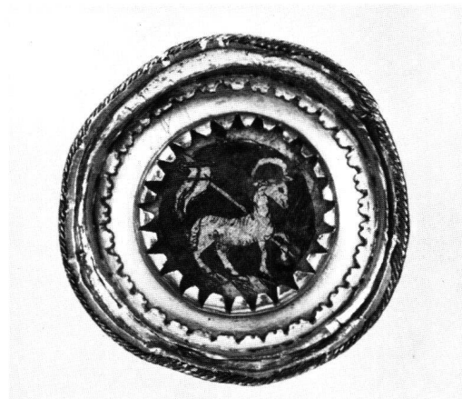
Abb.4 Wappenmedaillon und Fassung vom Fuss des oberen Teiles des Bechers. Durchmesser 4,5 cm. 19. Jahrhundert.

Wenden wir uns nach dieser eingehenden Beschreibung dem Verhältnis der beiden Becherhälften zu. Bei näherem Zusehen lässt sich erkennen, dass die obere Becherhälfte nicht auf die untere passt: Es ist ungewöhnlich bei einem Doppelkopf, dass der Durchmesser am Lippenrand der oberen Schale kleiner ist als derjenige am Lippenrand der unteren Schale; üblicherweise überdeckt die obere Schale den Lippenrand der unteren Schale. Die Metallfassung am Lippenrand der oberen Schale mit Wulst und Zarge ermöglicht zwar ein Ineinanderstecken der Becher, ist aber typisch für eine Anpassung und entspricht der Funktion des Gefässes als Trinkgefäss nicht. Das Ornament passt nicht, wie zu erwarten wäre, zur Gravur am Lippenrand der unteren Schale, sondern nimmt das Beschlagwerk am Fuss auf. Allerdings stimmt es im Detail nicht überein. Die Schale selbst ist weniger fein ausgedrechselt als ihr grösseres Gegenstück. Der Schaft entspricht jenem des unteren Bechers nicht, der Fuss ist behelfsmässig angepasst, wenig ausgearbeitet und kann