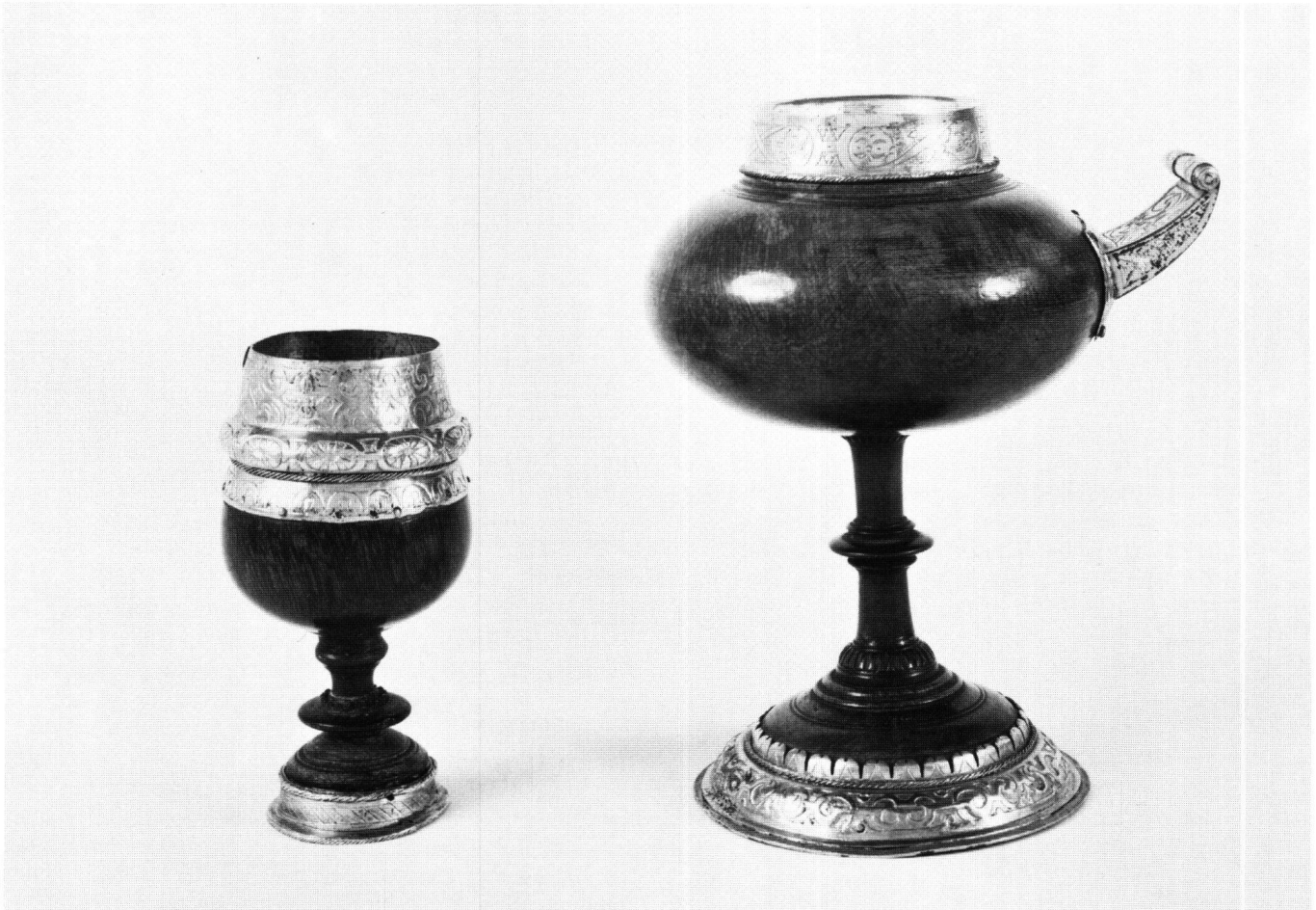
Abb. 3 Bruder-Klausen-Becher offen. Stans.

senschaft breit gewürdigt, andererseits müssen sie sich Verschönerungen und Vervollständigungen gefallen lassen, die oft verschwiegen werden.