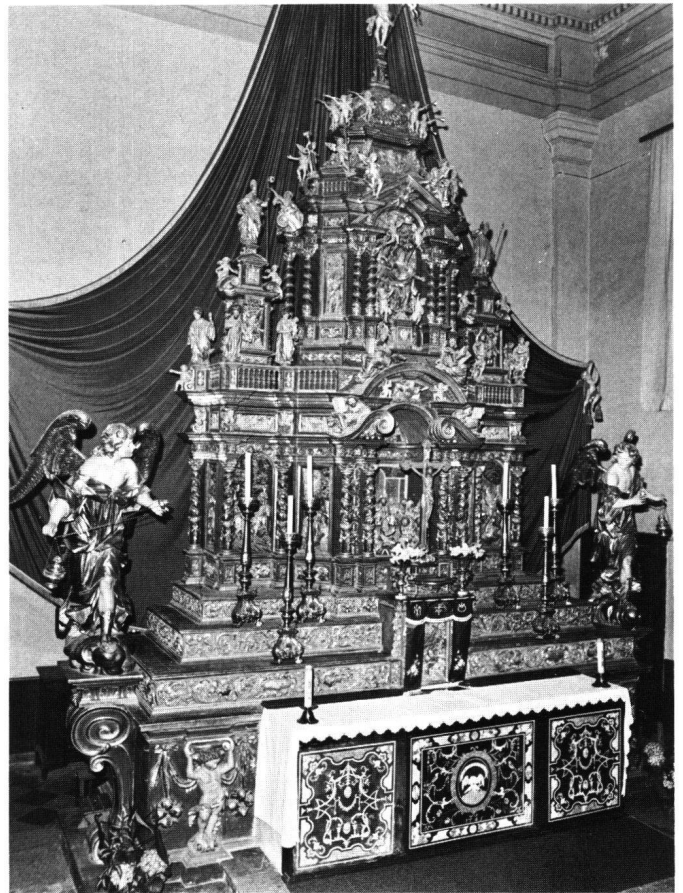
Fig. 1 Sessa (TI), église paroissiale. Retable du maître-autel, par Antonio Pini et Carlo Antonio Ramponi, 1662.

A titre anecdotique, signalons qu'un autre Gallo, le maître maçon prénommé Dominique, travaille à Saint-Maurice, en