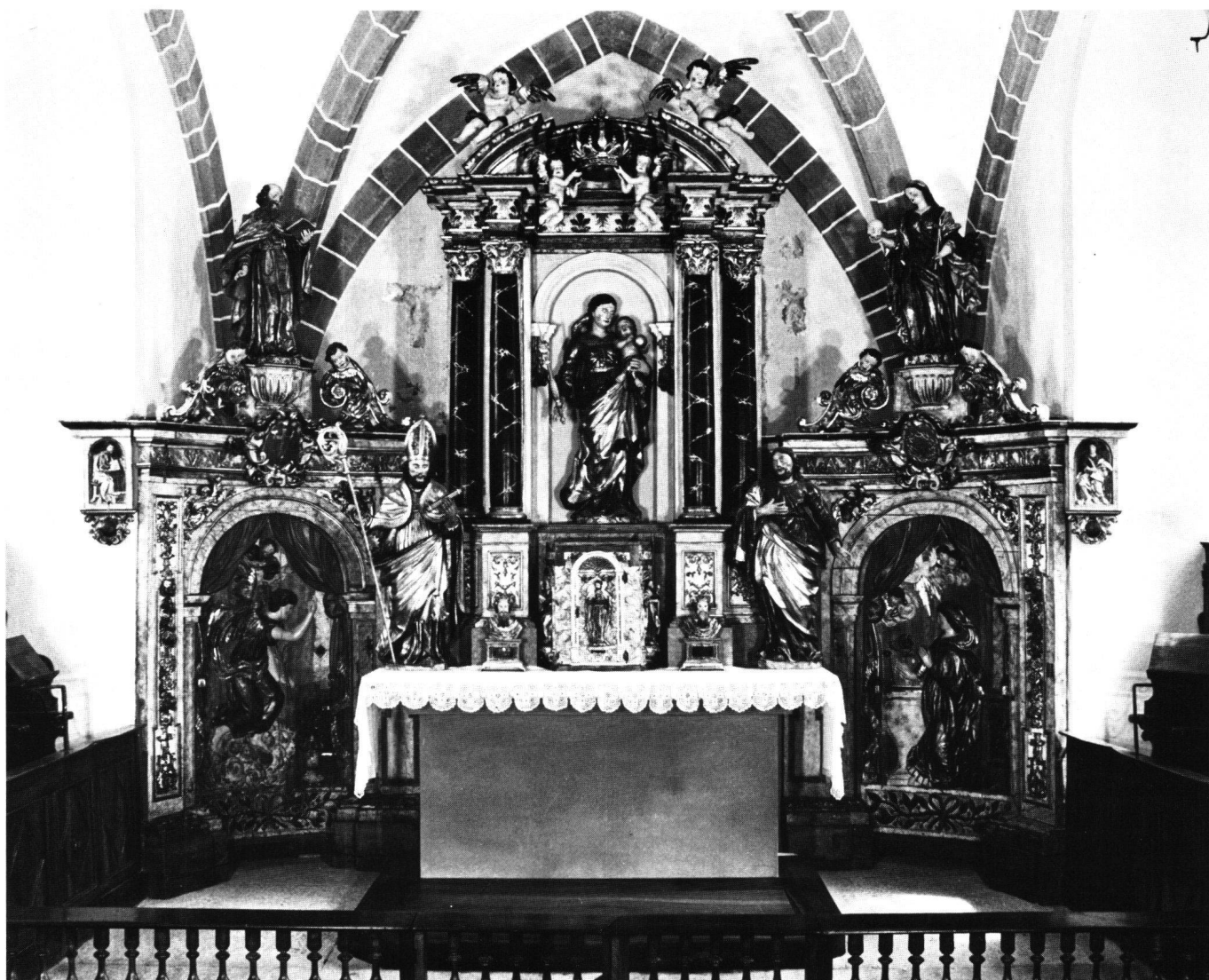
Fig. 3 Assens (VD), église mixte. Retable, fin XVII e ou 1 er quart XVIII e siècle, restauré 1982–1985.

encore laissé en ville de Fribourg, deux ans auparavant, un témoignage semblable de son art, objet d'ailleurs de jugements contradictoires. 43