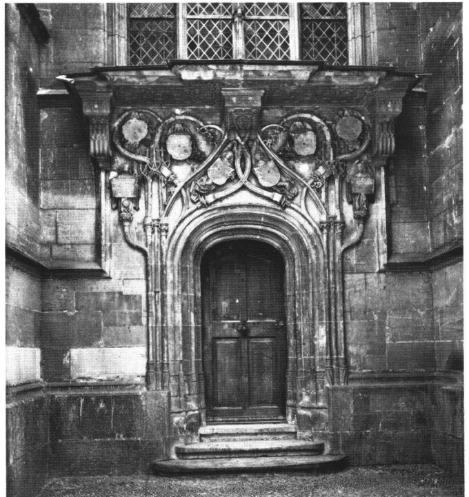
Abb. 5 Schulleissenpforte des Erhart Künig, 1491, Zustand kurz vor der Restaurierung von 1899, Bern, Münster.

Diese Beobachtungen lassen unseres Erachtens sehr gut die Ausgewogenheit der Komposition erkennen, die – trotz der grossen Zerstörung des Objektes – immer noch gut nachvollziehbar ist. Ebenso spürbar bleibt die hohe Qualität des Objektes, das mit zu den künstlerisch hochstehenden