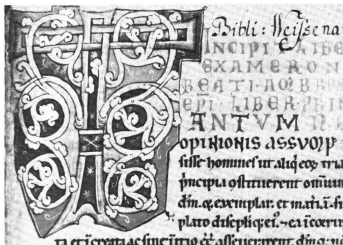
Fig. 9 Initiale T ouvrant le Liber Exameron de saint Ambroise. Amiens, ms Lescalopier 30, f. 1 (H: 8,5, L: 7,3 cm).

Les couleurs, d'abord. Elles sont identiques dans les deux manuscrits, et leur gamme est celle déjà décrite à propos du légendier genevois. Les thèmes, ensuite. A titre d'exemple,