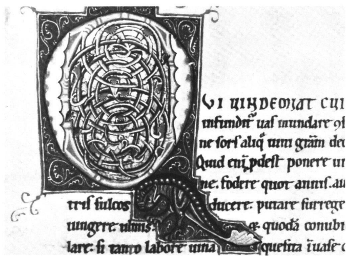
Fig. 11 Initiale Q avec un dragon. Amiens, ms Lescalopier 30, f. 55v (H: 8,4, L: 9,5 cm).

Peut-on, à partir des éléments précédents, parvenir à situer Rufillus dans le temps et l'espace? Son style d'enluminure frappe par la variété de courants artistiques qu'il rassemble. Ainsi, lorsqu'il peint des initiales à rinceaux blancs sur fonds colorés (voir fig. 8 et 9), c'est aux enluminures italiennes des XIe et XIIe siècles qu'il fait penser. 16 En exécutant des lettrines à rinceaux pleins et ombrés dans lesquels s'accrochent des feuilles aux formes de pieuvre