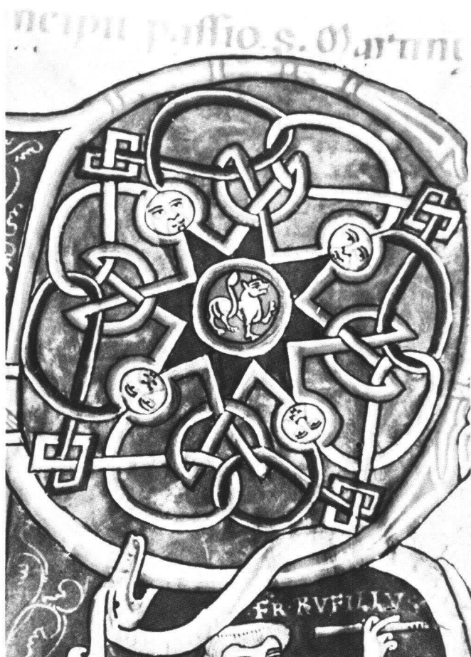
Fig. 6 Détail de la figure 1: entrelac avec visages humains. Genève, ms 127, f. 244.

pale d'Amiens (Ms Lescalopier 30) et qui provient aussi de Weissenau (fig. 2). 9 Au folio 29v de ce codex, qui contient le «Liber Exameron» de saint Ambroise, Rufillus s'est représenté, dans une petite initiale – un D, et non plus un R – dessinée en bas de page. C'est plutôt en tant que scribe qu'il s'est peint cette fois-ci, tenant d'une main un couteau et de l'autre une plume.