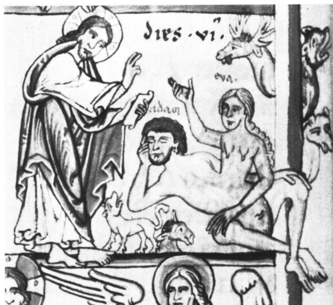
Fig. 5 Le sixième jour de la Création. Amiens, Bibliothèque Municipale, ms Lescalopier 30, f. 10v (détail) (environ H: 5,5, L: 8 cm).

Certainement réalisé par deux scribes différents, ce manuscrit contient une trentaine d'enluminures au moins qui ne peuvent être que de la main de Rufillus. Contrairement à son confrère qui préférait les tonalités douces, Rufillus a choisi des couleurs très vives et contrastées: un bleu outremer, un rouge vif, un vert foncé, un beige, un marron, un gris et enfin le noir pour les contours et le blanc pour les rehauts.