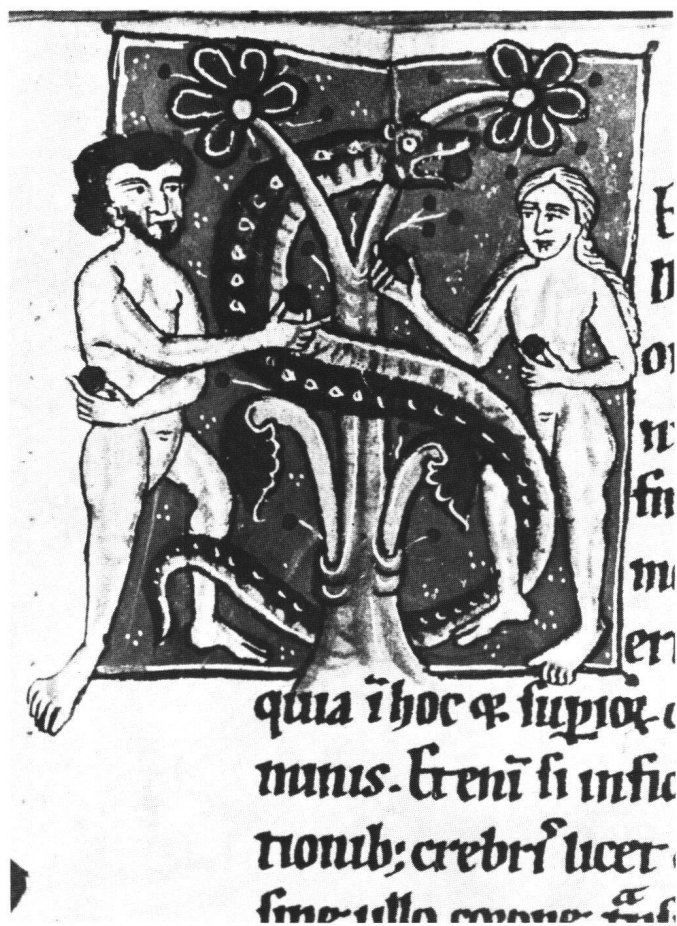
Fig. 4 Initiale S avec la Tentation d'Adam et d'Ève. Amiens, ms Lescalopier 30, f. 98v (environ H: 7, L: 6 cm).

Le codex 127 porte plusieurs indices qui nous renseignent sur son histoire et, d'abord, sur son lieu d'origine: le monastère prémontré de Weissenau près de Ravensburg, dans le diocèse de Constance. Fondé en 1145 par Gebizo de Ravensburg, riche seigneur guelfe, le monastère fut consacré à saint Pierre apôtre dès 1170. De prieuré, Weissenau – appelé au Moyen Age « Augia minor », « minor Augia » ou simplement « Augia » – fut promu abbaye en 1257 et connut une longue prospérité jusqu'à sa suppression en 1803, au moment de la grande laïcisation des institutions religieuses. 6 Une partie de sa bibliothèque devint alors propriété privée de son dernier abbé, Bonaventure Brem (1755–1818), avant d'être dispersée par la suite aux quatre coins du monde. 7