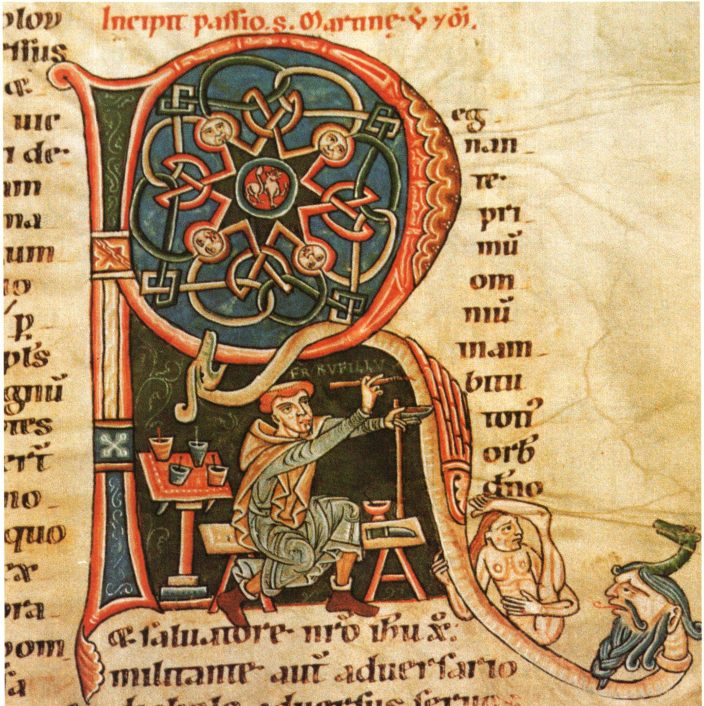
Fig. 1 Initiale R avec l'autportrait du miniaturiste Rufillus. Genève, Bibliothèque Bodmer, ms 127, f. 244 (H: 17,5, L: 15,5 cm).