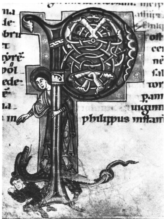
Fig. 10 Initiale P ouvrant la passion de saint Philippe représenté avec le fils du prêtre tué par le dragon. Genève, ms 127, f. 52 (H: 14,4, L: 9,5 cm).

serpent étrangement pourvu d'oreilles, il passe à un serpent à tête humaine sur le front duquel pousse une feuille.