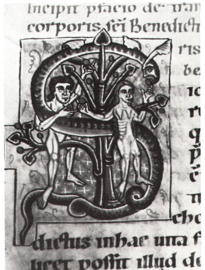
Fig. 3 Initiale S avec la Tentation d'Adam et d'Ève. Genève, ms 127, f. 257 (H: 9, L: 7 cm).

Au reste, notre enlumineur ne s'est pas contenté de se portraiturer, il s'est aussi situé, symboliquement parlant, au