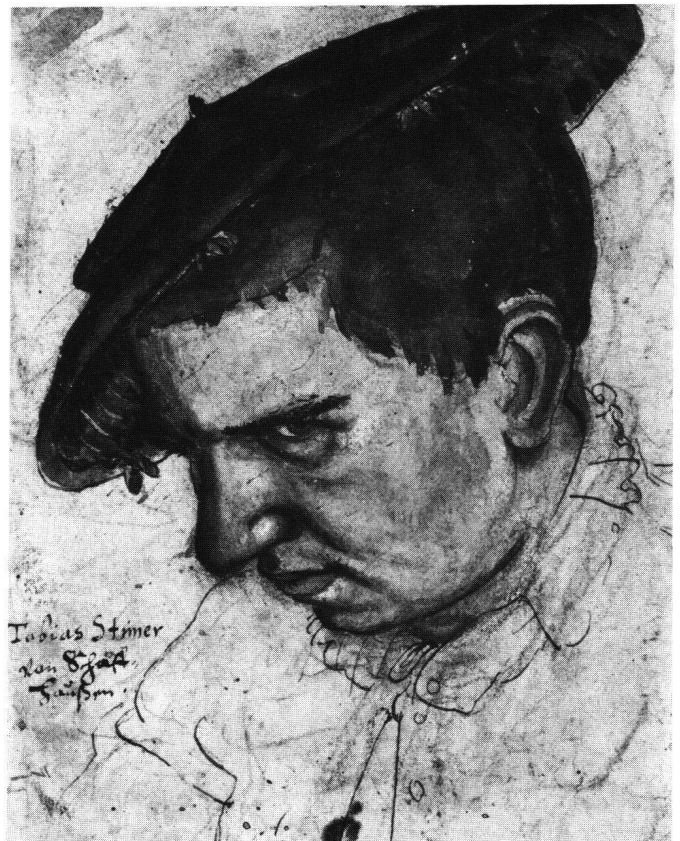
Abb. 12 Tobias Stimmer: Selbstbildnis, um 1563. Feder aquarelliert über Kreide, 19,7×15 cm. Donaueschingen, Fürstlich Fürstenbergische Sammlung.

Während Baldungs Holzschnitt auf Anhieb wirkt und schnell «gelesen» werden kann, verlangt Stimmers Zeichnung ein langsames Abtasten der relativ verschränkten Rhythmen, die sich in der dekorativen Fülle gegenseitig nicht nur steigern, sondern auch systematisch bremsen – gewollt offenbar. Solche «gebremste Lesbarkeit» gilt besonders deutlich auch für die Fassadenmalerei Stimmers, gerade wenn man sie mit Holbeins berühmten Gegenständen vergleicht, und ebenso für die Titelholzschnitte. Ja sie gilt sogar für die ausserordentlich rasch und frei gezeichnete, zügig erscheinende Helldunkel-Pinselzeichnung des «Malers mit seiner Muse», deren erst in eingehender Betrachtung sich erschliessende Komplexität uns zweifeln liess, ob sie sich als Plakatmotiv eigne (wir entschieden uns dann doch dazu). Gemessen an barocker Kunst oder nochmals an Urs Graf ist auch dieses Figurenpaar «paralysiert» in einem nur allmählich penetrierbaren Gefüge von Formen und Gegenständen. Die Langsamkeit der Lesung wird belohnt mit der Entdeckung wohlgebauter abstrakter Rhythmen auf der gültig bleibenden Grundlage eines ernsten Realismus.