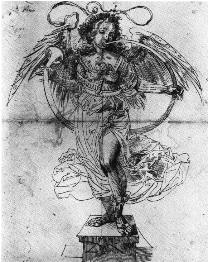
Abb. 11 Daniel Lindtmayer: Fama, 1579. Federzeichnung, 37,8×27,5 cm. Zürich, Graphische Sammlung des Kunstauses.