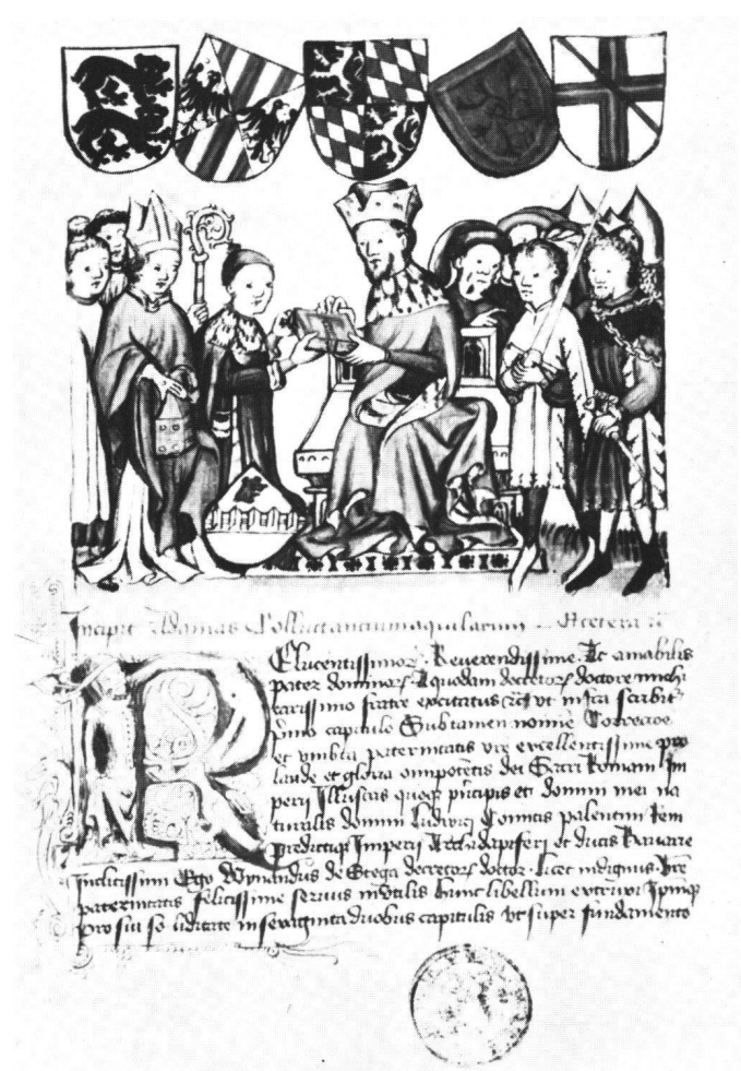
Abb. 1 Fol. 1r; Widmungsbild.

Absurditäten solcher Art sind möglich, weil die Bilder des Adamas collectancium aquilarum noch in keiner Weise in Verbindung zum Text, den sie begleiten, gebracht und nicht einmal geläufige religiöse Themen als solche erkannt worden sind 5 .