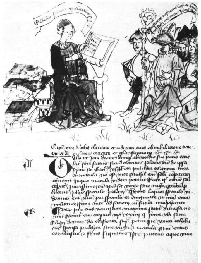
Abb. 5 Fol. 43v; Bischof mit Eselkopf.

In der Tat hebt sich eine Reihe von Bildmotiven von dem recht akademisch gehaltenen Text, mit dem sie oft nur in losem Zusammenhang stehen, ab. Diese Motive sind nicht direkt von biblischen und exegetischen Texten abgeleitet und gehören auch nicht zum festen Bestand kirchenpropagandistischer Motive, sondern stammen letztlich aus dem profanen Kulturbereich. Dazu gehört das schon erwähnte heraldische Motiv des Doppeladlers und dann Motive, die kirchliche Missstände anprangern, nämlich die Bilder eines affenköpfigen Bischofs mit heraushängender Zunge und insbesondere das Bild eines Bischofsesels 46 . Beim Anblick tierköpfiger kirchlicher Würdenträger kann man nicht umhin, an den durch Luther und Melanchthon berühmt gewordenen Papstesel zu denken. Damit kommen wir zum Problem der Bildpropaganda vor der Zeit der Reformation, die auf satirische Weise Missstände anprangert oder eventuell die römische Kirche als Institution überhaupt in Frage stellt.