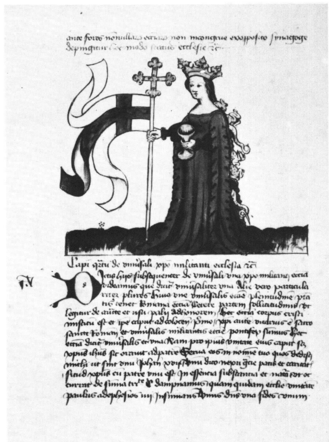
Abb. 6 Fol. 12v: Ecclesia als Frau Welt.

einigen kirchlichen Würdenträgern gegenüber als ein Unikum zu betrachten. Der allgemeine sittliche Verfall der Geistlichen stand am Konzil von Konstanz auf der Traktandenliste. Winand kritisiert denn auch, entsprechend einer langen Tradition, den jämmerlichen Zustand der Glieder, jedoch nicht des Hauptes und auch nicht der Institution an sich. Die symbolische Entkopplung der kirchlichen Institution, durch einen tierköpfigen Papst ausgedrückt, bleibt den radikalen Gegnern der bestehenden Kirche vorbehalten. Im Laufe des 15. Jahrhunderts wird zum Beispiel der Papst als Reinhard Fuchs auf dem Rad der Fortuna dargestellt 59 . Andererseits kann doch die Tatsache, dass Winand in der Eigenkritik so weit geht, Bischöfe mit Affen- und Eselskopf, also Figuren, die wie die hussitischen Christ-Antichrist-Bilder im öffentlichen Schandritual dienen konnten, aufzunehmen, als bezeichnend für die Krise der Kirche angesehen werden. So finden wir auch in der Zeit des Exils von Avignon, in der zum Teil geradezu vorreformatorische Zustände herrschten, und in der darauffolgenden Epoche des Schismas von Seiten reformgesinnter Prediger beissendste Satiren auf den Klerus. Der Dominikaner John Bromyard zum Beispiel, ein erbitterter Gegner Wycliffs, geisselt die gesamte Hierarchie und beschwört die bei Winand dargestellte Kirche als Frau Welt mit ihrem verrotteten Rückenteil 60 . Er betont,