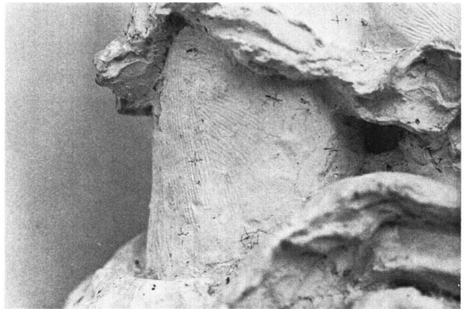
Fig. 4 Portrait de la Baronne de Keffenbrinck, 1876; plâtre primaire au niveau du bras droit: points fins marqués de croix tracés au crayon. Fondation Marcello, Fribourg.