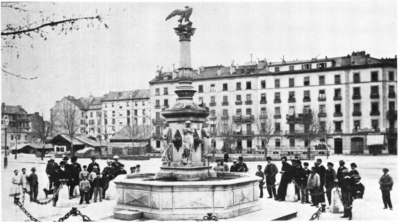
Fig. 4 Louis Dorcière, Fontaine de la place des Alpes, 1859 (état vers 1870).