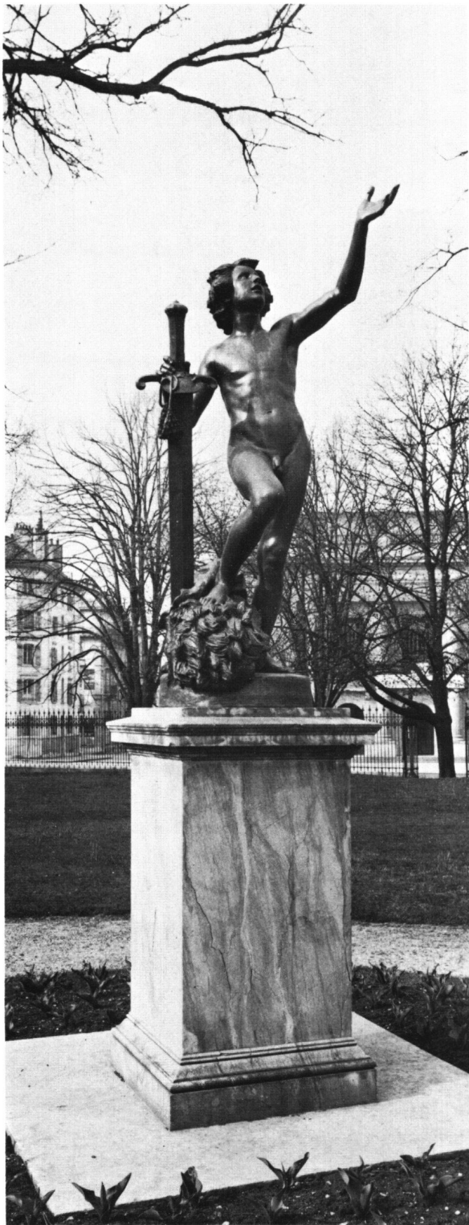
Fig. 2 John Chaponnière, David vainqueur de Goliath, 1834.