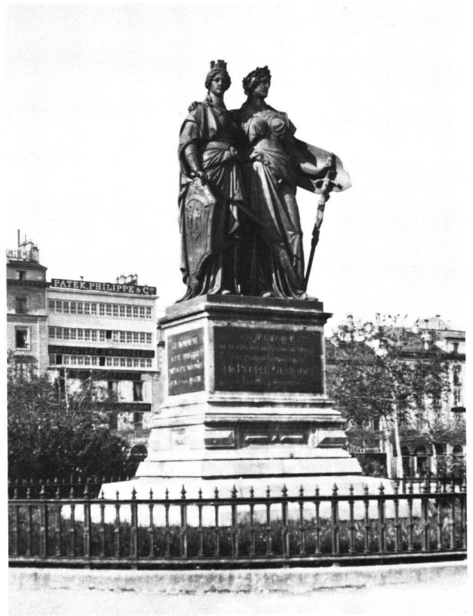
Fig. 5 Robert Dorer, Monument national, 1869 (état vers 1900).

Inauguration du Mausolée du duc de Brunswick, Quai du Mont-Blanc. Commandé tout d'abord à Vincenzo Vela dont la maquette et plusieurs statues en vraie grandeur sont conservées au Musée Vela à Ligornetto. Le monument fut confié à l'architecte français Jean Fernel qui réalisa cette grande entreprise de 1877 à 1879 en répartissant les travaux