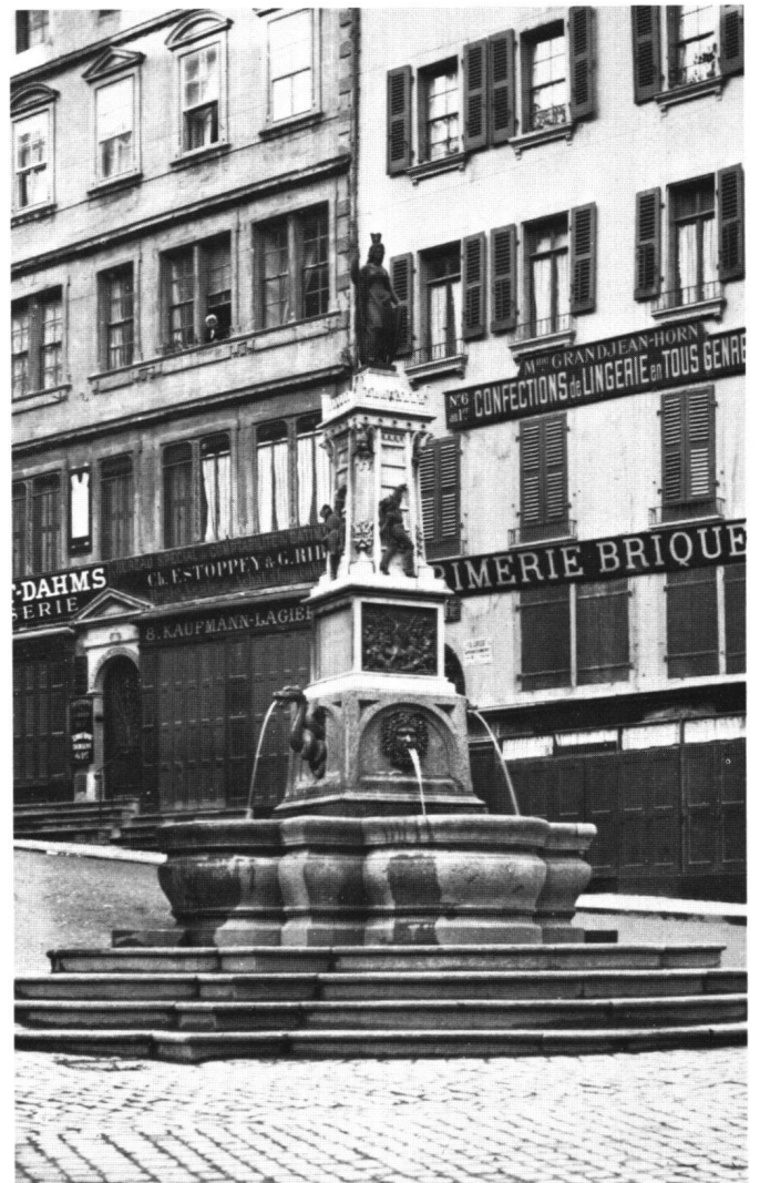
Fig. 3 Johannes Leeb, Fontaine de l'Escalade, 1857 (état vers 1890).

Inauguration de la Fontaine de l'Escalade. Pierre et bronze. Située au bas de la rue de la Cité (fig. 3).