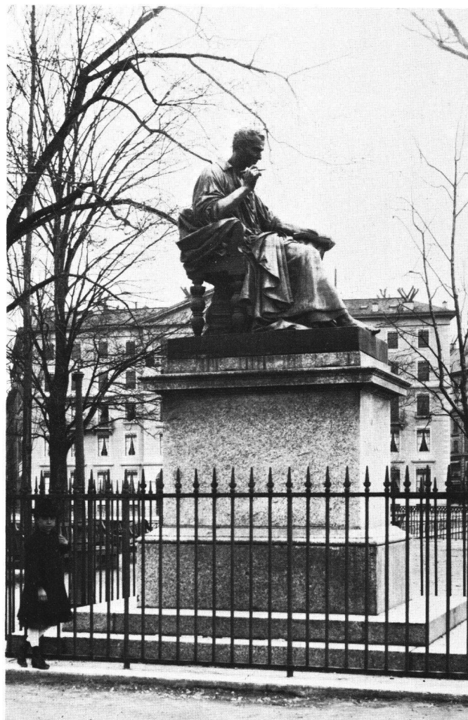
Fig. 1 James Pradier, Monument de Jean-Jacques Rousseau, 1834 (état vers 1900).

Inauguration du monument à Auguste Pyrame de Candolle. Bronze fondu par Eugène Gonon en 1845. Placé dans le jardin des Bastions. Original aujourd'hui au Musée d'art et d'histoire.