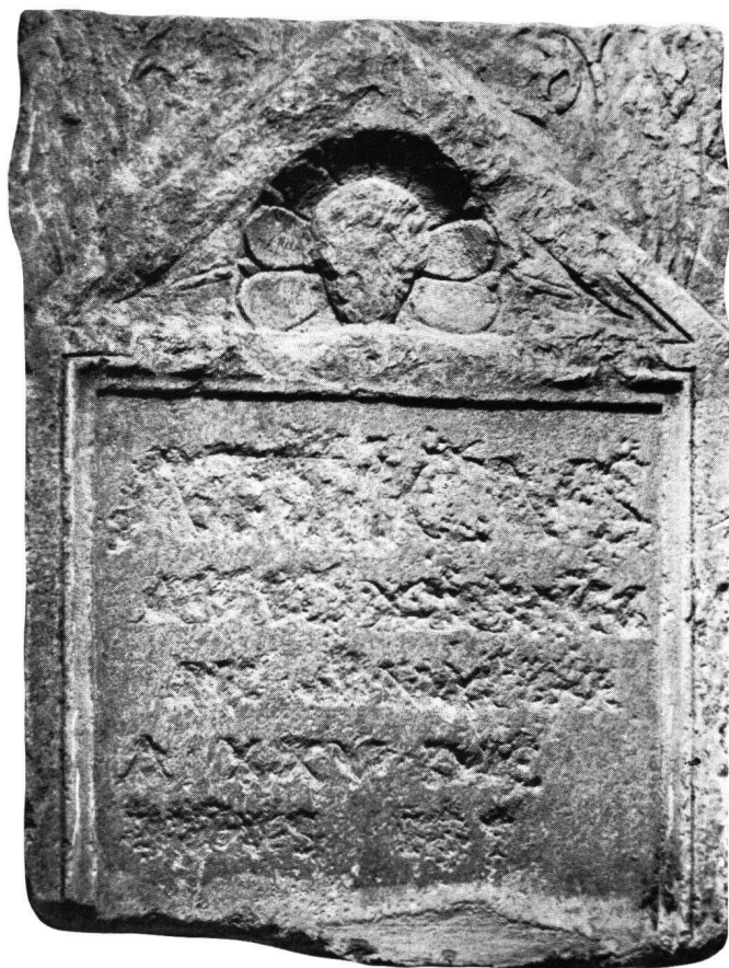
Fig. 1 Stèle funéraire d'Atticus Senator (Musée archéologique, Sion)

Grâce à un moulage, il nous a été possible de transcrire d'une manière satisfaisante l'inscription de 5 lignes: