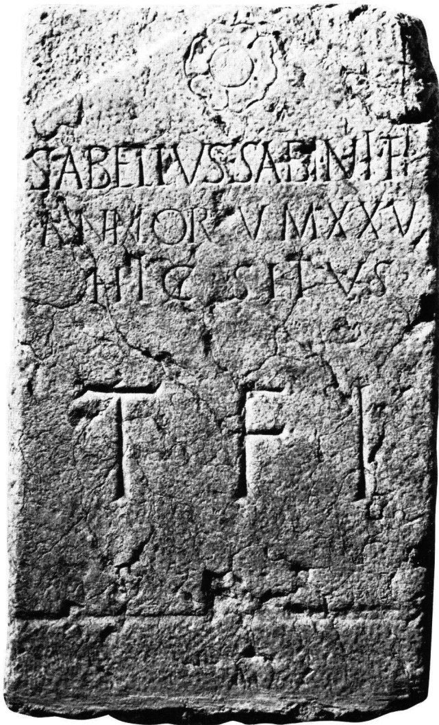
Fig. 3 Stèle funéraire de Sabellus (Musée archéologique de Sion)

supérieures du fronton, orné d'une rosette, sont simplement indiquées par la taille légèrement en retrait des angles supérieurs de la dalle. Dans sa partie inférieure, une ligne indique peut-être le niveau jusqu'auquel elle était enfoncée dans la terre.