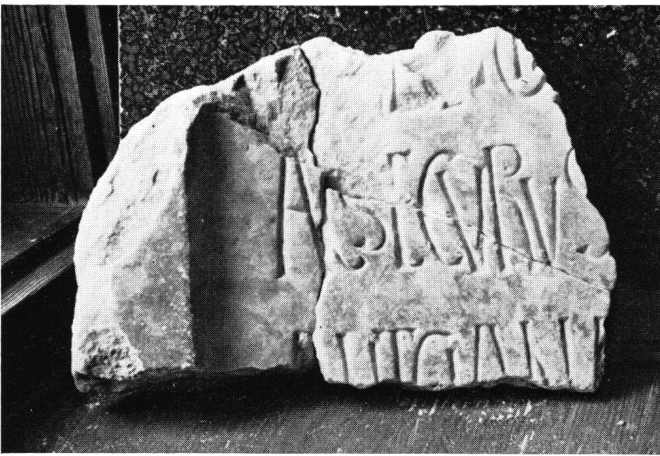
Abb. 2 Inschriftenfragment aus Müstair, gefunden 1948

Im ganzen handelt es sich um eine rein romanische Majuskelschrift, ohne jegliche unzialen Elemente, wie sie dann die Gotik sehr liebte. Das gleiche gilt vom romanischen Siegelstempel des Disentiser Abtes Walter (1185–1200) 7 . Diese Stilbindung ändert sich, wenn wir die Inschrift auf der romanischen Stifterfigur in Platta (Medels) aus dem Anfang des 13. Jahrhunderts vergleichen 8 .