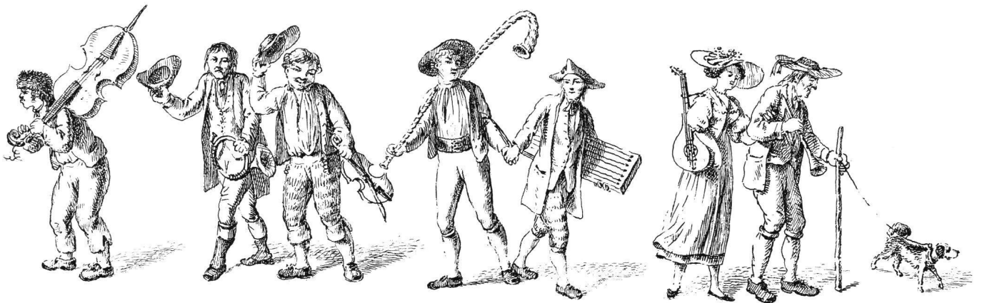
Abb. 2 Schlußvignette (Aus: Sammlung von Schweizer Kühreihen und Volksliedern , 4. Aufl., bey J.J. Burgdorfer, Bern 1826)

ser sitzt und hat sein Instrument vom Munde ab- und mit dem Schallbecher auf dem Boden aufgesetzt 9 .