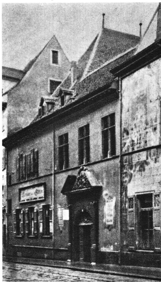
Abb. 3 Linker Teil des spätmittelalterlichen Zunfthauses zur Safran in Basel, abgebrochen 1900. Aufnahme von etwa 1890

Aus den beiden Eintragungen ergibt sich, daß Holbein auch nach seiner Einbürgerung in Basel (am 3. Juli 1520) – in ähnlicher Weise wie vordem in Luzern – wiederholt mehr handwerkliche Malarbeiten ausführte und daß er sich bei der Ausübung seines Malerberufs kaum wesentlich von den gleichzeitig mit ihm tätigen Basler Meistern (zum Beispiel Hans Dig 9 und Hans Herbst) unterschied. Man denke in diesem Zusammenhang auch an die in den