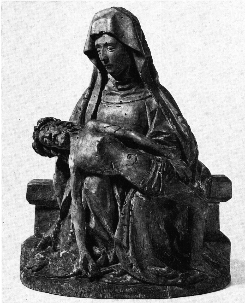
Pietà, milieu du XV e siècle. Bois de tilleul avec traces de polychromie. Hauteur 37 cm. Acquise dans la vallée de Delémont

Le Musée jurassien de Delémont, fondé par l'abbé Arthur Daucourt (1849–1908), abrite une remarquable collection de sculptures, réunie principalement au début du XX e siècle et provenant de toutes les parties du Jura. A part la très belle Vierge de Delémont, remontant aux premières décennies du XIV e siècle et conservée aujourd'hui au Musée historique de Berne, la sculpture jurassienne n'est guère connue en dehors de son pays d'origine. Les églises du Jura possèdent de beaux ensembles sculptés du XVIII e siècle, œuvres notamment de Urs Fueg et des frères Breton, mais le petit nombre de sculptures médiévales conservées ne correspond pas à l'activité artistique que les textes nous laissent entrevoir, au XV e siècle, par exemple. Pour se faire une idée de l'intérêt de cette sculpture et de sa diversité quant à son origine (Franche-Comté, Alsace, Bâle, Berne, Allemagne du Sud), il faut recourir à la belle collection du Musée jurassien. Grâce à l'obligeance de la Commission du Musée et de son dévoué président, M.E. Philippe, nous pouvons présenter quelques-unes des œuvres les plus anciennes, photographiées par les soins du Musée national suisse.