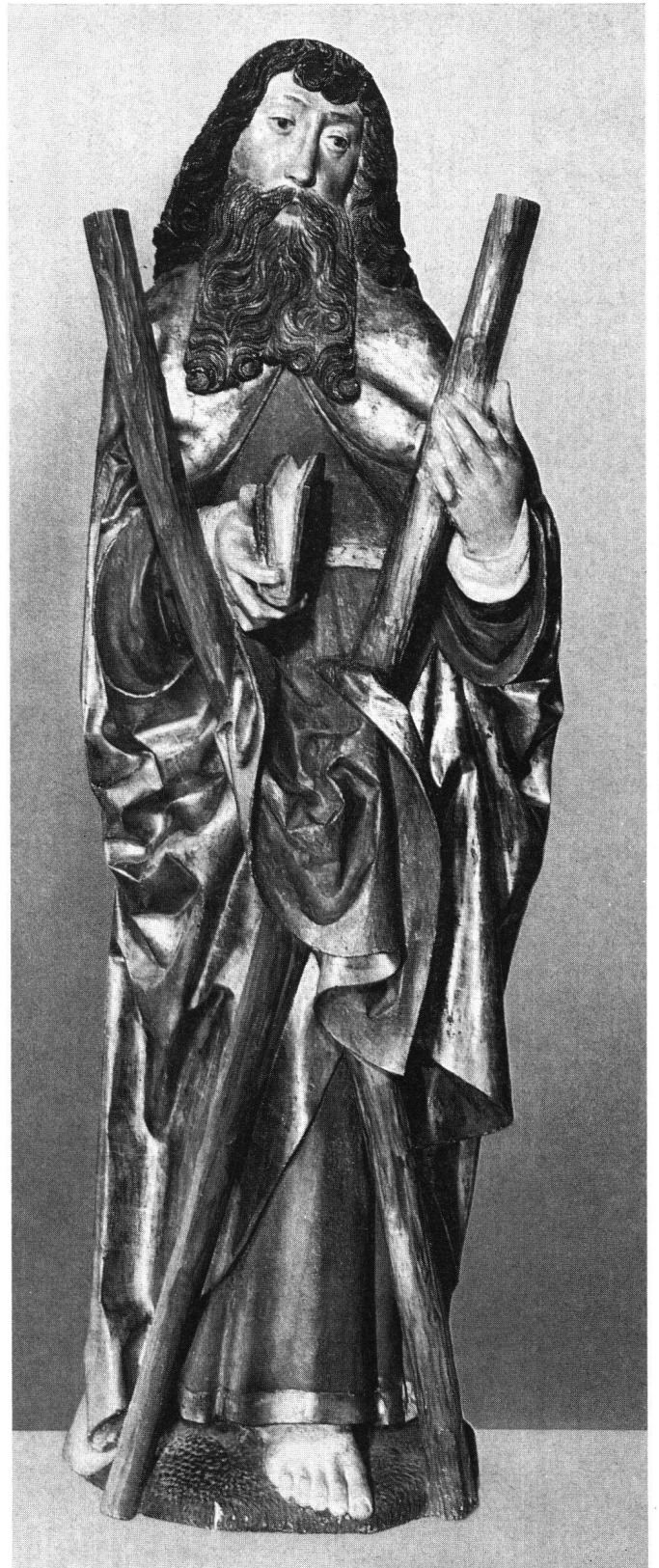
Saint Laurent et saint André. Bois de tilleul évidé, avec polychromie ancienne. Hauteur 174 et 175 cm. Proviennent de l'ancien retable, détruit, du maître-autel de l'église paroissiale de Delémont, exécuté de 1508 à 1510 par MARTIN LEBZELTER de Bâle