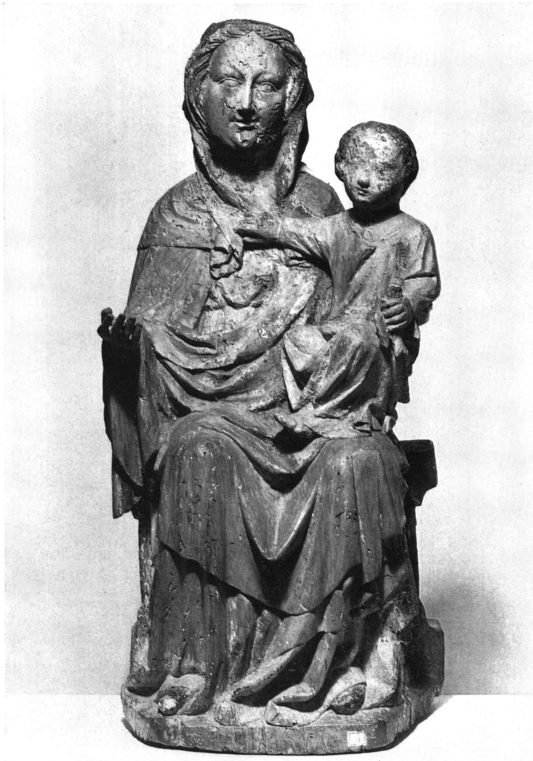
Vierge à l'Enfant, premier tiers du XVI e siècle. Bois de tilleul avec traces de polychromie. Hauteur 76 cm. Acquisée chez un collectionneur de St-Ursanne qui l'avait découverte à Courgenay