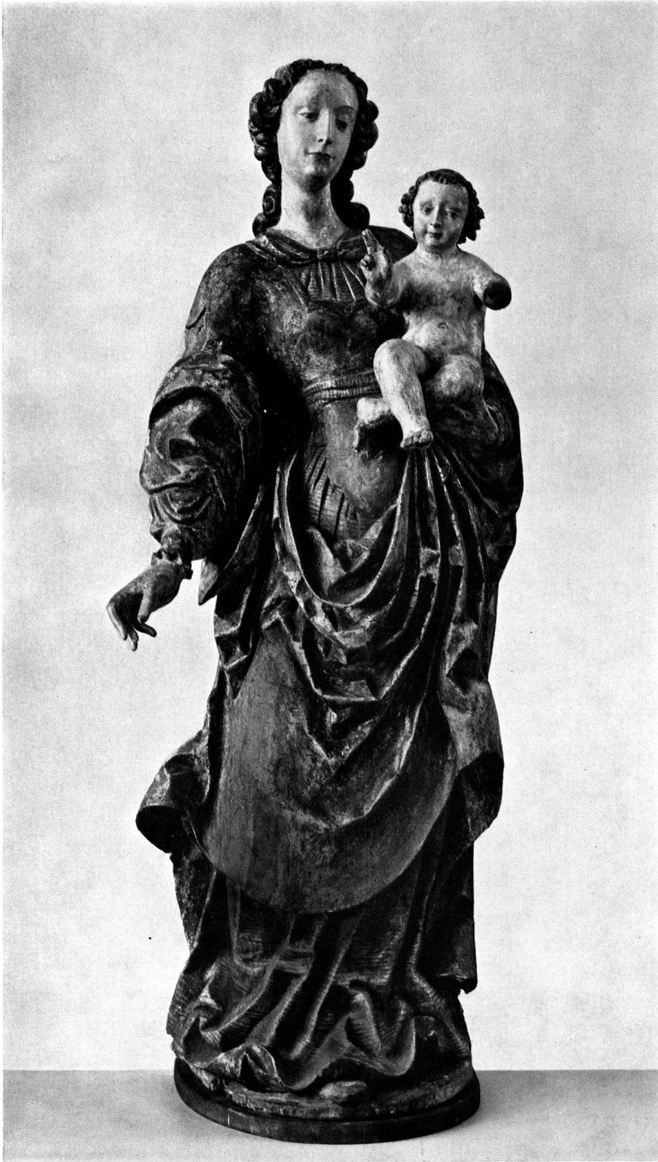
Madonna mit Kind, Lindenholz, H. 160 cm, dreiviertelrund, Rückseite gehöhlt, ursprüngliche Fassung weitgehend erhalten. – Zürich, Schweizerisches Landesmuseum.