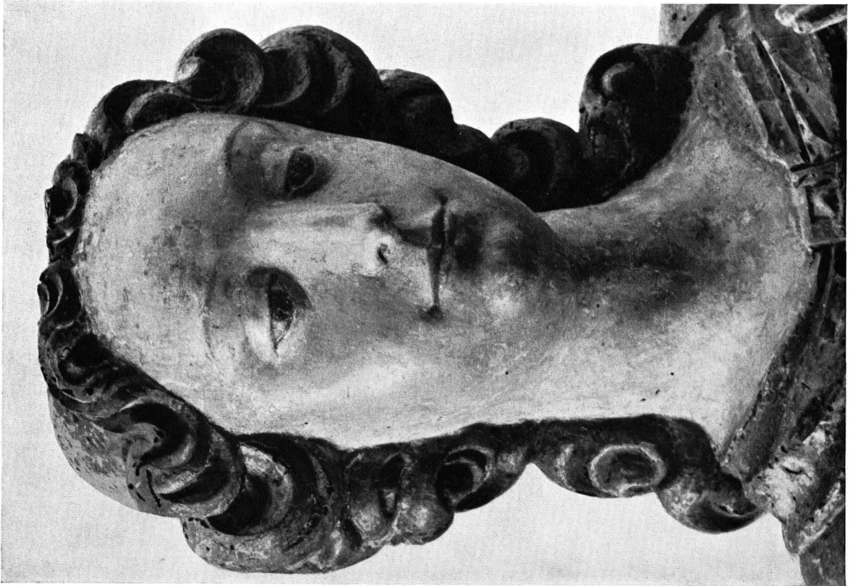
a Kopf der Madonna aus Tafel 41. b Kopf der Madonna aus Tafel 43c.