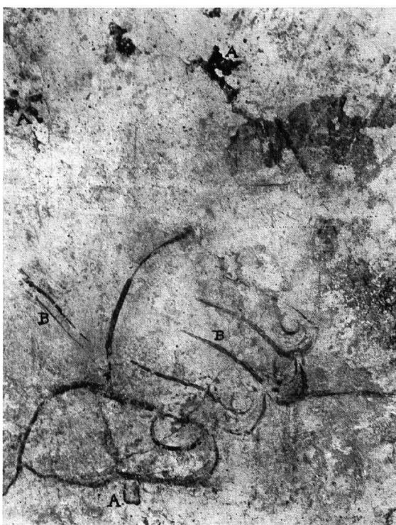
Abb. 3 (links). Kapelle von Schloß Gruyères. Fuß eines Apostels. A: Erhaltene Partien der definitiven Zeichnung. B: Die durchscheinende Vorzeichnung in Tempera, die unter der Einwirkung der Luft und des Kalkgrundes zum Fresko wurde