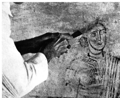
Abb. 4. Kirche von Zillis. Die Abdeckungsarbeit wird unrichtiger Weise mit einem ungeeigneten, zu breiten Instrument durchgeführt