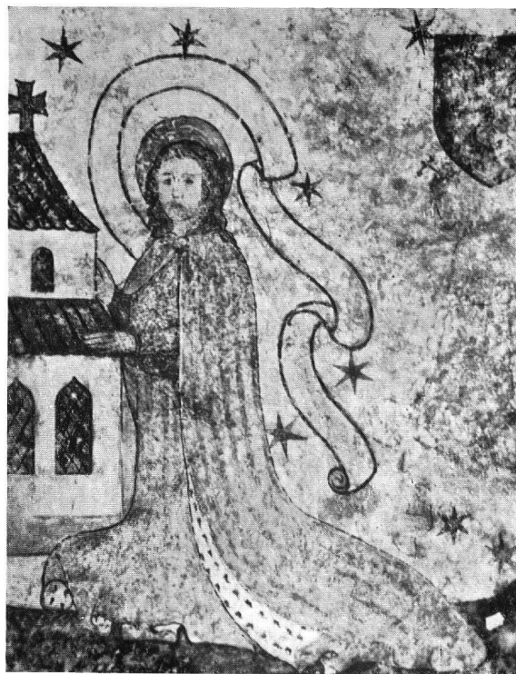
Abb. 6. Kirche von Stein a. Rhein. Die gleiche Partie nach ungenügenden Anhaltspunkten vom Arbeiter frei ausgemalt