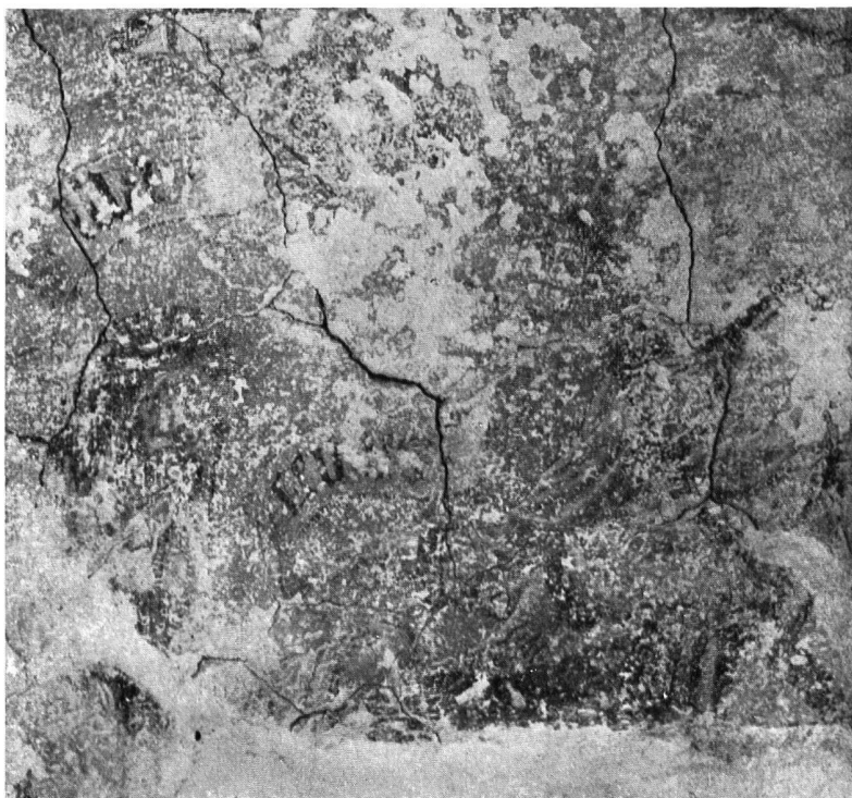
Abb. 9. Teil der Wandmalerei nach der ersten ungenügenden Reinigung