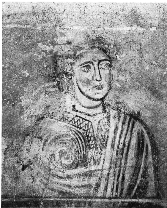
Abb. 7. Kirche von Zillis. Zustand der Malerei nach der ersten ungenügenden Reinigung