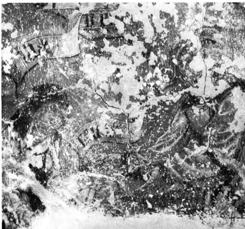
Abb. 10. Die gleiche Partie nach der zweiten vollständigen Reinigung

RESTAURATION VON WANDMALEREIEN Kloster St. Georgen, Stein a. Rhein. Untere Abtstube