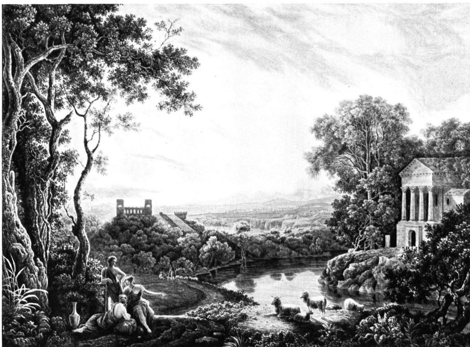
Fig. 1. Kupferstich von William Woulet, 1763 nach dem Gemälde von Richard Wilson «Phaeton»