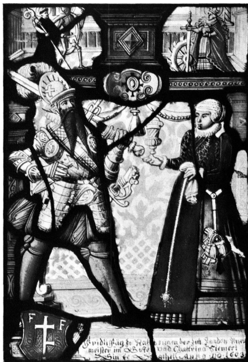
Abb. 4. Scheibe Fäh-Steiner, 1603