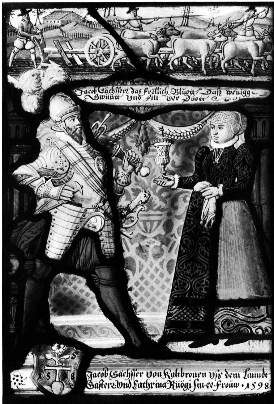
Abb. 1. Scheibe Sechser-Rüegg, Kaltbrunn, 1598